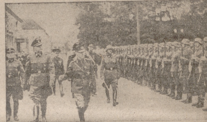
El general Antonescu, jefe del Estado rumano, visitó el monumento a los héroes durante su reciente visita a Munich