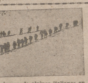
Frete griego-albanés.—Una columna de alpinos italianos en marcha hacia las posiciones avanzadas de Grecia