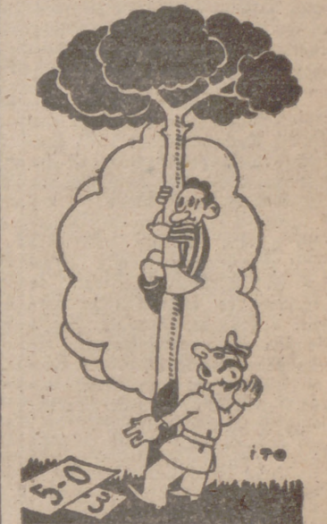
CUCASA DEPORTIVA, por ITO ¡Adelante, Valladolid! ¡¡¡A por la copa!!!

El arbitraje de Celestino Rodríguez, perfecto. Los equipos se alinearon así: Valladolid: José Miguel; Busquet, Sasot; Barrios, Torquemada, Rufo; Lizasoain, Estrada, Arienza, Zaurín y Las Heras. Real Ferrol: Yurrita; Caliche, Portugués; Silgosa, Conesa, Emilio; Carolo, Landeta, Nicola, Herodes y Miranda. ANDETER