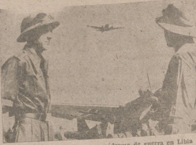
Aviadores alemanes en un aeródromo de guerra en Libia

Sofía, 7.—El Alto Mando de las fuerzas aéreas búlgaras ha publicado el comunicado siguiente: "Los aviones de bombardeo yugoslavos han atacado hoy las ciudades abiertas de Sofía y Kintendil. Estos ataques se desarrollaron a gran altura y fueron dirigidos contra objetivos no militares. En Kintendil sobre el centro de la ciudad y en Sofía en los arrabales del Oeste. Las víctimas ocasionadas son mujeres y niños. Los daños han sido insignificantes e inmediatamente fueron reparados."—Efe.