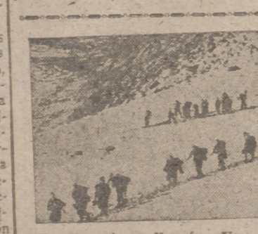
Frete griego-albanés.—Una columna de alpinos italianos en marcha hacia las posiciones avanzadas de Grecia