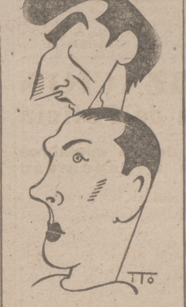
ZAURIN y ARIENZA (Caricaturas por ITO)

tienen el domingo próximo una ocasión magnífica: Vencer en El Ferrol. ¿Por qué no? No les sería difícil si salen al campo dispuestos a ello, y además de pensar que un gran ataque es siempre la mejor defensa, y por lo mismo nada perderían probando.