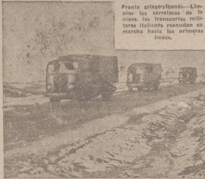
Frante aragobanés.—Limpias las carreteras de la nieve, los transportes militares italianos reanudan su marcha hacia las primeras líneas.

MATSUOKA VISITARÁ TAMBIÉN MOSCÚ Nueva York, 8.—La radio americana, ocupándose del viaje de Matsuoka, dice que éste no solamente visitará Berlín y Roma, sino que también irá a Moscú, donde firmará un pacto de no agresión. Dicha noticia, al difundir la noticia, no menciona la fuente de información en donde recogió aquella.—Efe.