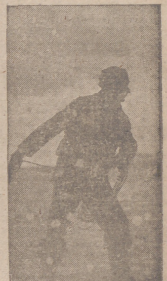
Desde un submarino italiano, que después de un crucero de guerra regresa a la base, un marinero echa la guita de la estación para el atraque

Segundo.—Interrupción súbita y simultánea de todas las vías de comunicación importantes.