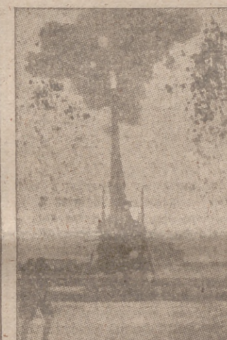
En la costa de la Mancha: Un cañón de grueso calibre abre el fuego contra el litoral inglés.

De Brinon hizo responsable a Inglaterra de la difícil situación alimenticia en que se encuentra la zona libre de Francia, y contestó negativamente a la pregunta de si el Gobierno francés esperaba la llegada de víveres procedentes de Norteamérica.—Efe.