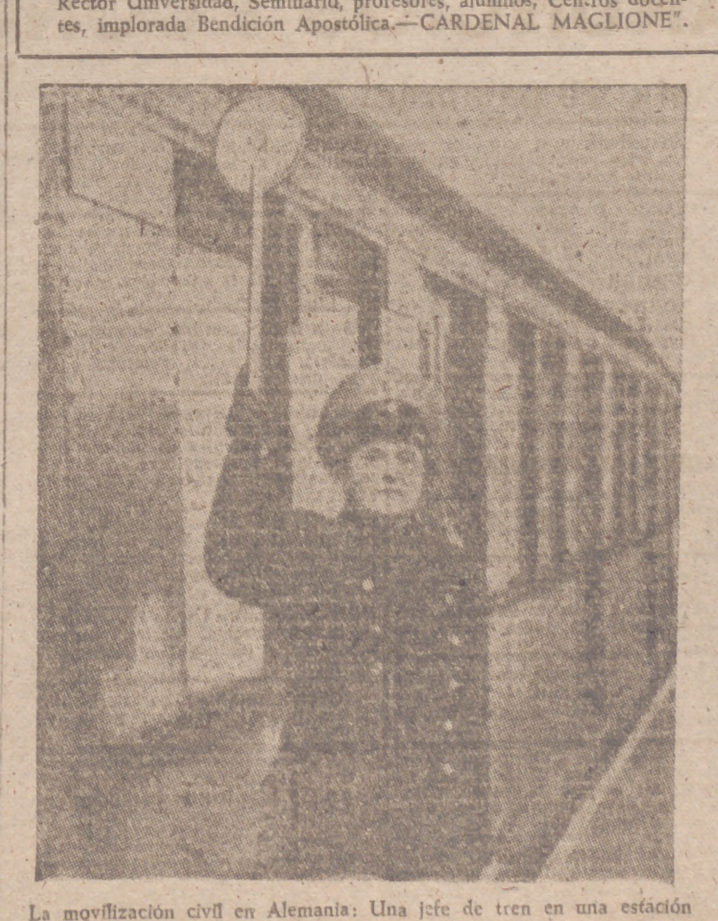
La movilización civil en Alemania: un jefe de tren en una estación ferroviaria

«Ciudad Vaticano.—Agradando que solemnidad Patrón de Escuelas Católicas produzca copiosos frutos juvenutud estudios, Augustus Pontifice, vivamente complacido, otorga de corazón Vuecencia, Rector Universidad, Seminario, profesores, alumnos, Centros docentes, implorada Bendición Apostólica.—CARDENAL MAGLIONE».