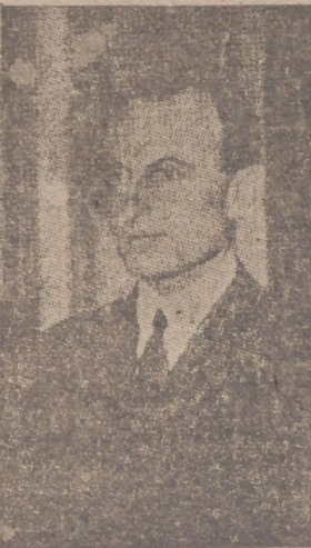
El regente Pablo de Yugoslavia

La Prensa búlgara considera probable e inminente la adhesión de Yugoslavia al pacto tripartito, y los medios políticos búlgaros ven en esta actitud de la política exterior yugoeslava síntomas favorables respecto al eje Roma-Berlin. Los periódicos continúan exaltando la amistad entre Alemania y Bulgaria. El "Zora" pone especialmente de relieve la técnica y la organización del Ejército alemán, cuyos soldados son la mejor expresión de la Alemania creada por Hitler.—Efe.