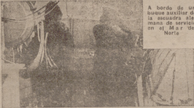
A bordo de un buque auxiliar de la escuadra alemana de servicio en el Mar del Norte

Atenas, 15.—La aviación enemiga efectuó sin resultado un bombardeo en las orillas del desierto de Creta.—Efe.