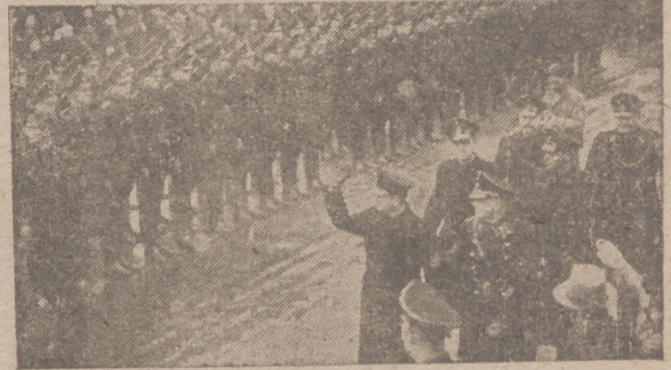
Las primeras formaciones de las tropas S. S. e. Holanda, organizadas según el ejemplo alemán

Conmuevo encontrar en el Museo Victoria y Alberto de Londres una vitrina con libros sevillanos de oficios del siglo XVI. Porque Sevilla fué la metrópoli de la imprenta en la España del Renacimiento, como lo fué, asimismo, de la talla, del estofado, la pintura y aun de la arquitectura y la estatuaria. Algunos de esos primores los ha dejado morir en ocios y olvidos. Las artes del libro, que aún a finales del pasado siglo—en tiempos del marqués de Jerez de los Caballeros—eran sevillanas, tienen hoy más cultivo en Barcelona. Sin embargo, por lo que aún conserva de tradición de oficios y gusto por la belleza, yo propongo a Sevilla tallista y alfarera para capital de la artesanía española.