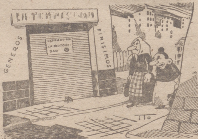
EPOCA DE CAZA Por ITO

Berlín, 10.—Al mediodía de hoy los aviones de combate británicos, acompañados por aviones de caza, han intentado efectuar un ataque contra la costa francesa de la Mancha. Como hace algunos días, tropezaron con una defensa de gran energía. En los combates aéreos sostenidos con este motivo un avión "Spitfire" fue derribado por los cazas alemanes y otros dos del mismo tipo por las baterías antiaéreas. La aviación alemana no sufrió pérdidas.—Efe.