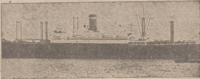
El antiguo vapor americano «Presidente Harding» que, puesto al servicio de Inglaterra, ha sido hundido por la Marina de guerra del Reich, como tantos otros ya de la misma procedencia

Vichy, 10.—La agencia Transocean desmiente los rumores difundidos por la radio británica relativos a desórdenes registrados en Vichy y a la supuesta salida para Africa septentrional del mariscal Pétain y el almirante Darlan.—Efe.