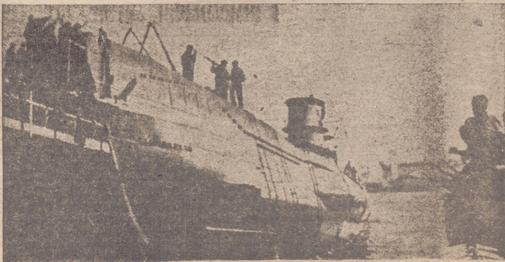
Los astilleros alemanes construyen sin cesar submarinos potentes que, poco a poco, van aniquilando las flotas inglesas. Esta foto recoge el momento en que un nuevo sumergible se hace a la mar en busca de días de gloria para su Patria

8. Todo el control de la vida económica, comercial y monetaria, será ejercido por la Dirección de Economía a través de la Oficina de Economía de Tánger.—Cifra.