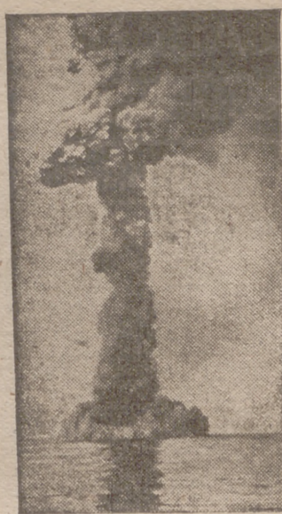
Los rastreadores alemanos repasan continuamente las aguas del Canal de la Mancha limpiándolas de minas inglesas, que son explotadas.—He aquí el impresionante espectáculo de hacer explosión uno de los artefactos ingleses

Un periodista preguntó a Willkie si estaba convencido de la victoria británica, pero sólo obtuvo una respuesta evasiva, y que de momento no quería afirmar que una victoria británica fuese cierta, pero que tampoco la opinión contraria respondía exactamente a su creencia.—Efe.