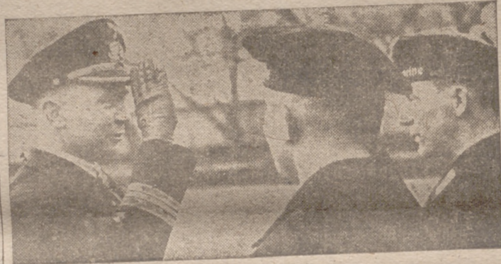
El teniente capitán Prien, el famoso «as» de los submarinos alemanes, condecora a dos hombres de su tripulación después de unas acciones contra el enemigo coronadas de éxito

Londres, 10.—La Embajada de Estados Unidos ha declarado hoy que el enviado personal del presidente Roosevelt, Hopkins, ha dado por terminada su misión en Gran Bretaña y ha partido con dirección a Estados Unidos.—Efe.