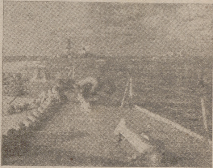
Una escuadra naval italiana en crucero de guerra.

En marcha el resurgimiento de la artesanía, "herencia viva de un glorioso pasado gremial", en cumplimiento de lo que determina la declaración del punto IV del Fuero del Trabajo, el Servicio Nacional de Artesanía de la Delegación Nacional de Sindicatos, a quien por voluntad expresa del Caudillo está exclusivamente encomendada esta labor, viene haciendo todo lo preciso para que un aspecto tan importante de la economía nacional vuelva a cobrar su auge de otros tiempos, y es su