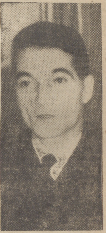
El contraalmirante Carlos Larrazábal, presidente de la Junta Militar que se ha hecho cargo del Poder en Venezuela.

VILLEMSTAD (Curazao), 23. Los últimos informes procedentes de Caracas recibidos la pasada noche dicen que 145 personas han resultado muertas y unas 600 heridas en los choques habidos en aquella ciudad.