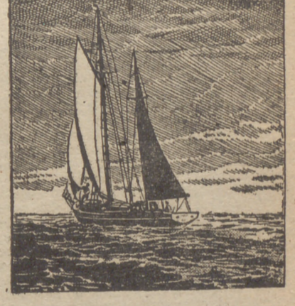
Al llegar la noche, el "Laura" cambia de ruta con la esperanza de desembarazarse del "Caprice", el barco de Voisin, que les sigue.