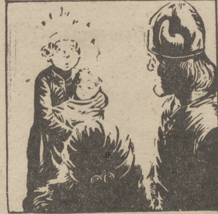
"Bien, todo el mundo se ha ocupado de la batalla y nadie por el niño. Parece contento contigo, Pum-Pum. Debes quererle como a un hermano."