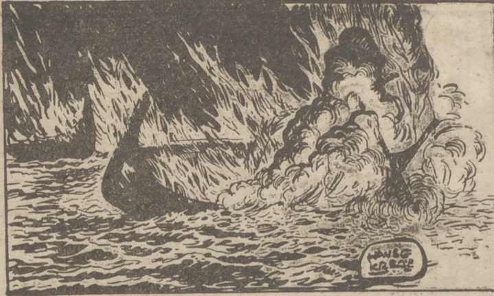
Y, efectivamente, unos instantes después, el barco de Vulko se hundía para siempre con los dos valientes enamorados. Habían logrado la gloria eterna con el sacrificio de sus vidas.