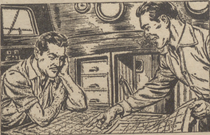
"Creo que ves montañas donde sólo hay colinas. Voisin es un lobo de mar incapaz de villanias. Pero en fin, tú eres quien diriges. Haz lo que creas más conveniente."