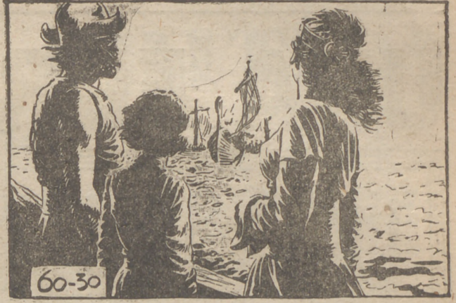
"Adiós, Ragnar, amigo mío—dice Erick viendo alejarse la flota amiga después de terminada la batalla—. Gracias a su ayuda hemos eliminado a los terribles bohushans, y podemos estar de nuevo juntos."