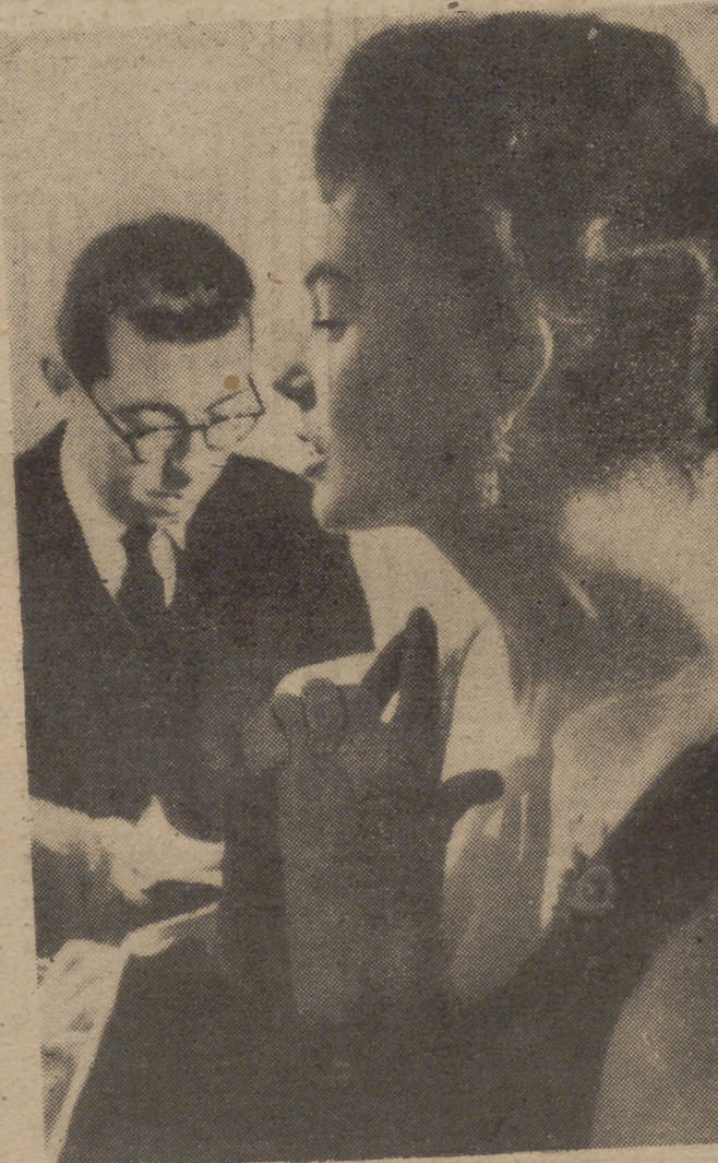
La estrella Dawn Addams ha sido elegida para actuar en el próximo film que realice Charlie Chaplin. Aquí aparece mostrando su perfil a los periodistas.