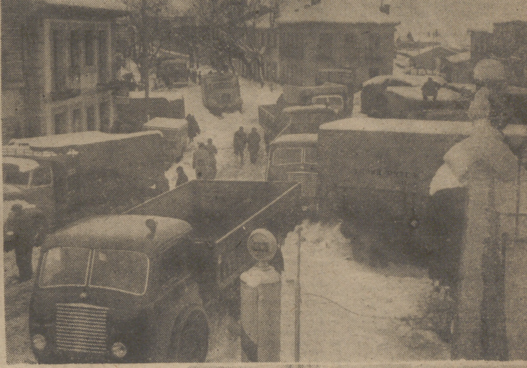
La nieve paralizó los transportes en toda España. Trenes que no pudieron continuar su marcha, camiones atascados en el Puerto de Guadarrama, que quedó cerrado. Por fortuna, la temperatura ha aumentado y ha comenzado el deshielo, permitiendo que los trenes procedentes del norte llegaran a Madrid. Nuestras fotografías muestran aspectos de una concentración de camiones en el pueblo de Guadarrama y el anuncio de que el puerto está cerrado.

Los trenes de mercancías sólo llegan hasta El Escorial. Se encuentran cerradas al tráfico todas las carreteras que parten de Madrid hacia el Norte. En cuanto se refiere a las comunicaciones telefónicas, la capital de España se halla incomunicada telefónicamente con Segovia, La Granja, Boceguilla, Hoyo de Manzanares, El Molar, Lozoyuela, Torrelavega, Santander, Burgos, Miraflores, Puerto de Navacerrada. Con Villalba, pueblo con el que hemos hablado esta mañana, nos han comunicado que en aquel lugar se hallan detenidos gran número de coches, ante la imposibilidad de pasar los Puertos del Alto de los Leones y Navacerrada, debido a la gran cantidad de nieve que hay sobre la carretera, que hace imposible el tránsito.