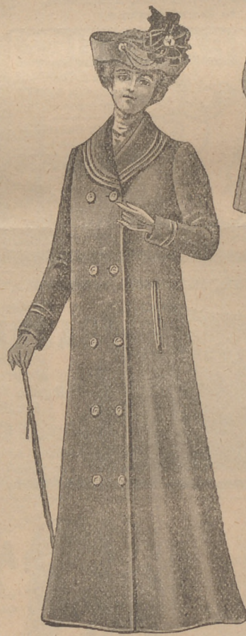
Forma Edinburgh DB.