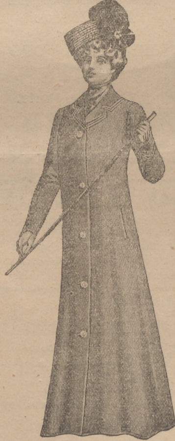
Forma Aberdeen SB.