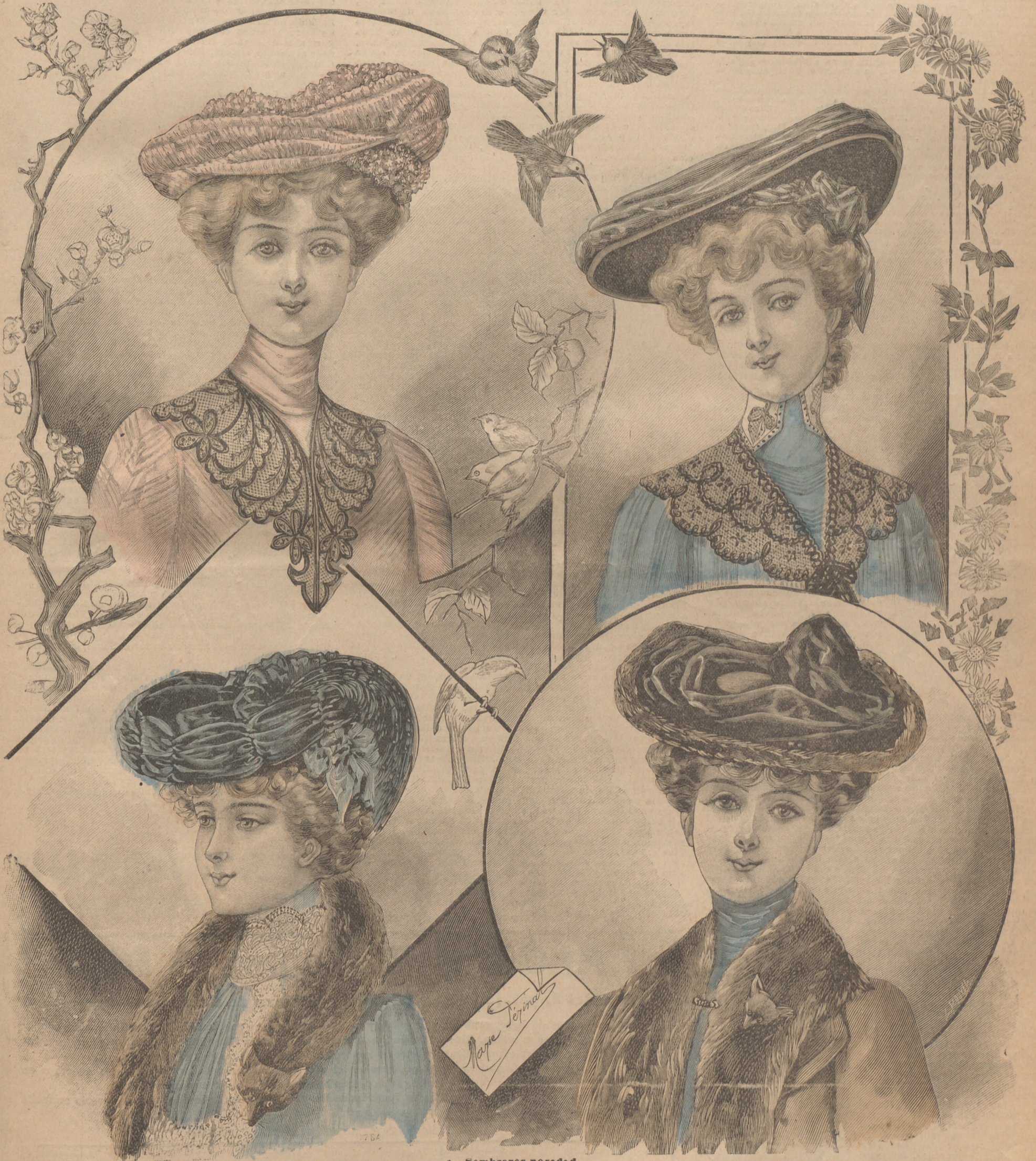
1. Sombreros novedad.

SUSCRIPCIÓN 6 Meses. 1 Añ. En toda España 4 pts. 7'50