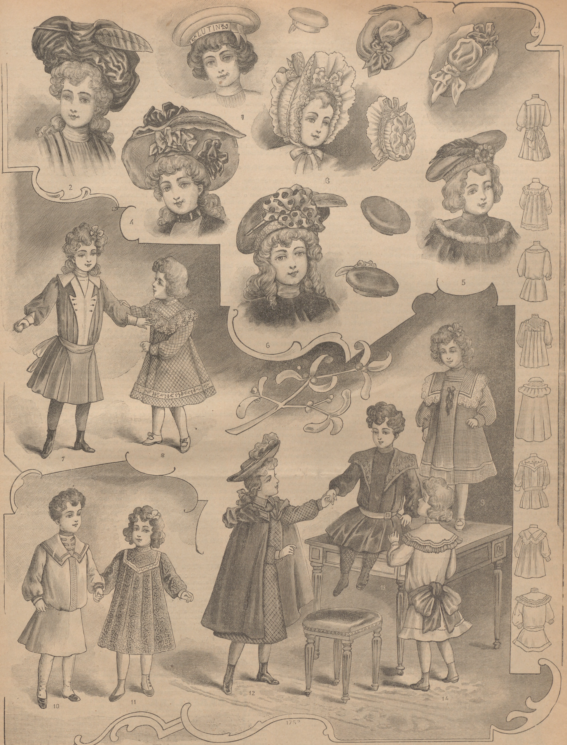
6. Boinas, sombreros para niña - Vestidos para niñas y niños