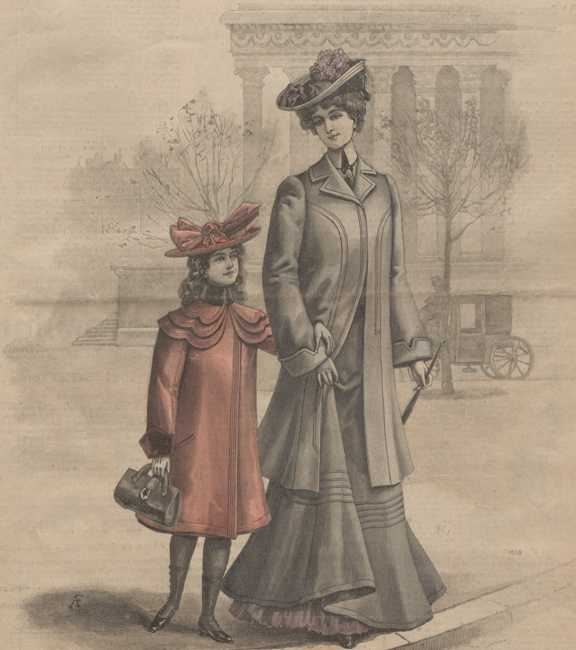
1. Abrigos y vestidos para señoras y señoritas.

SUSCRIPCIÓN 6 Meses. 1 Año. En toda España. 4 pts. 7'50