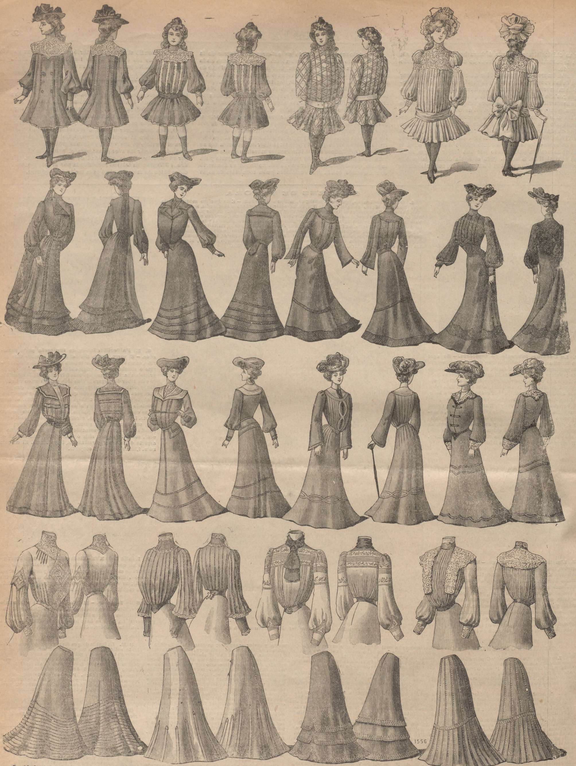
8. Abrigos y vestidos para niñas. Toilettas de paseo y de luto. Cuerpos y faldas I. Abrigo para niña de 9 á 10 años, de paño mástico. Espalda y delantero plisados. Cuello de guipure. Mat.: 2 m. paño. — II. Espalda de la fig. 1. — III. Vestido para niña de 4 á 5 años, de lanilla azul nilla. — IV. Espalda de la fig. 3. — V. Vestido para niña de 6 años, de tejido escocés, forma recta, plissé á grandes pliegues. Cinturón de cuero; mangas-blusa. Mat.: 2'50 m. tejido. — VI. Espalda de la fig. 5. — VII. Vestido para niña de 4 años, de crepón rosa pálido, plissé á pliegucillos sobre un canesú recubierto de guipure. Cinturón de raso liberty. Mat.: 2 m. crepón. — VIII. Espalda de la fig. 7. — IX. Vestido de casimir, guarnecido de crepón inglés. Falda plisada, colocada sobre un fondo de falda con volante en forma. Cuerpo-blusa. Mat.: 6 m. casimir. — X. Espalda de la fig. 9. — XI. Vestido de sarga. Falda en forma, circuida de biesses de crepón. Cuerpo abierto sobre un plastrón de crepón rodeado de un cuello-solapas. Mat.: 6 m. sarga. — XII. Espalda de la fig. 11. — XIII. Vestido de granito, guarnecido de biesses de crepón. Falda en forma. Cuerpo modelando el busto. Mat.: 6 m. granito. — XIV. Espalda de la fig. 13. — XV. Vestido de cheviotte negra. Falda-coselete descansando sobre un cuerpo de crepón plissé; mangas-blusa. Mat.: 5 m. cheviotte; 2'50 m. crepón. — XVI. Espalda de la fig. 15. — XVII. Vestido de paño gris ceniza. Falda plisada. Cuerpo-blusa abriéndose sobre un plastrón de tafetán blanco. Mat.: 6 m. paño, 0'50 m. tafetán. — XVIII. Espalda de la fig. 17. — XIX. Vestido de paño bronceado, guarnecido de junquillos respunteados. Cuerpo-blusa guarnecido de un cuello de paño blanco y de un plastrón de guipure. Mat.: 6 m. paño. — XX. Espalda de la fig. 19. — XXI. Vestido de lanilla madera. Falda y cuerpo plisados; este último escotado sobre un canesú de tafetán. Mat.: 6 m. lanilla. — XXII. Espalda de la fig. 21. — XXIII. Vestido de paño negro, guarnecido de terciopelo. Cuello y carteras de la manga de guipure. Mat.: 6 m. paño. — XXIV. Espalda de la fig. 23. — XXV. Cuerpo de tafetán gris-platado, guarnecido de guipure. Manga recorrida sobre un alto abullonado de muselina de seda ceñido por un puño de guipure. Mat.: 4 m. tafetán. — XXVI. Espalda de la fig. 25. — XXVII. Cuerpo de tafetán azul marino, enteramente plissé. Mat.: 4'50 m. tafetán. — XXVIII. Espalda de la fig. 27. — XXIX. Cuerpo de seda givrine rubi, forma blusa, escotado sobre un canesú guarnecido de bordado ejecutado en la misma tela. Mat.: 4'50 m. seda. — XXX. Espalda de la fig. 29. — XXXI. Cuerpo de crepón de China violina, plissé á pliegucillos. Cuello de guipure; mangas-blusa. Mat.: 5 m. crepón de China. — XXXII. Espalda de la fig. 31. — XXXIII. Falda de paño, plissé á pliegucillos dispuestos al través. — XXXIV. Espalda de la fig. 33. — XXXV. Falda de paño forrada de tafetán, guarnecida de junquillos respunteados. — XXXVI. Espalda de la fig. 35. — XXXVII. Falda corta, con doble volante pelerina guarnecida de respuntes. — XXXVIII. Espalda de la fig. 37. — XXXIX. Falda plisada de paño, terminando bajo un junquillo respunteado que sujeta un volante plissé. — XL. Espalda de la fig. 39.