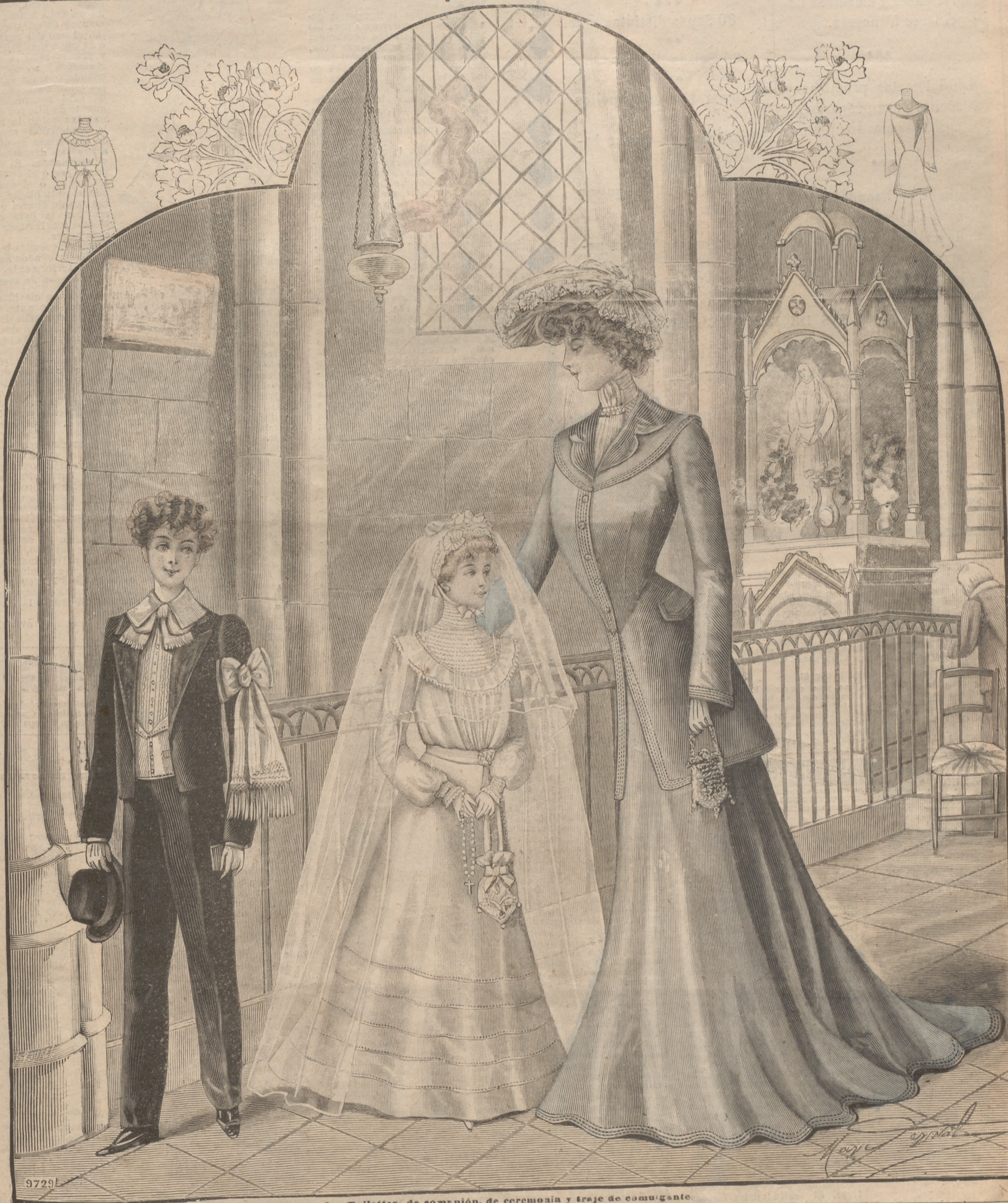
1. -Toilettes- de comunión, de ceremonia y traje de comulgante.

SUSCRIPCIÓN 6 Meses. 4 pts. 7.50 En toda España. 4 pts. 7.50