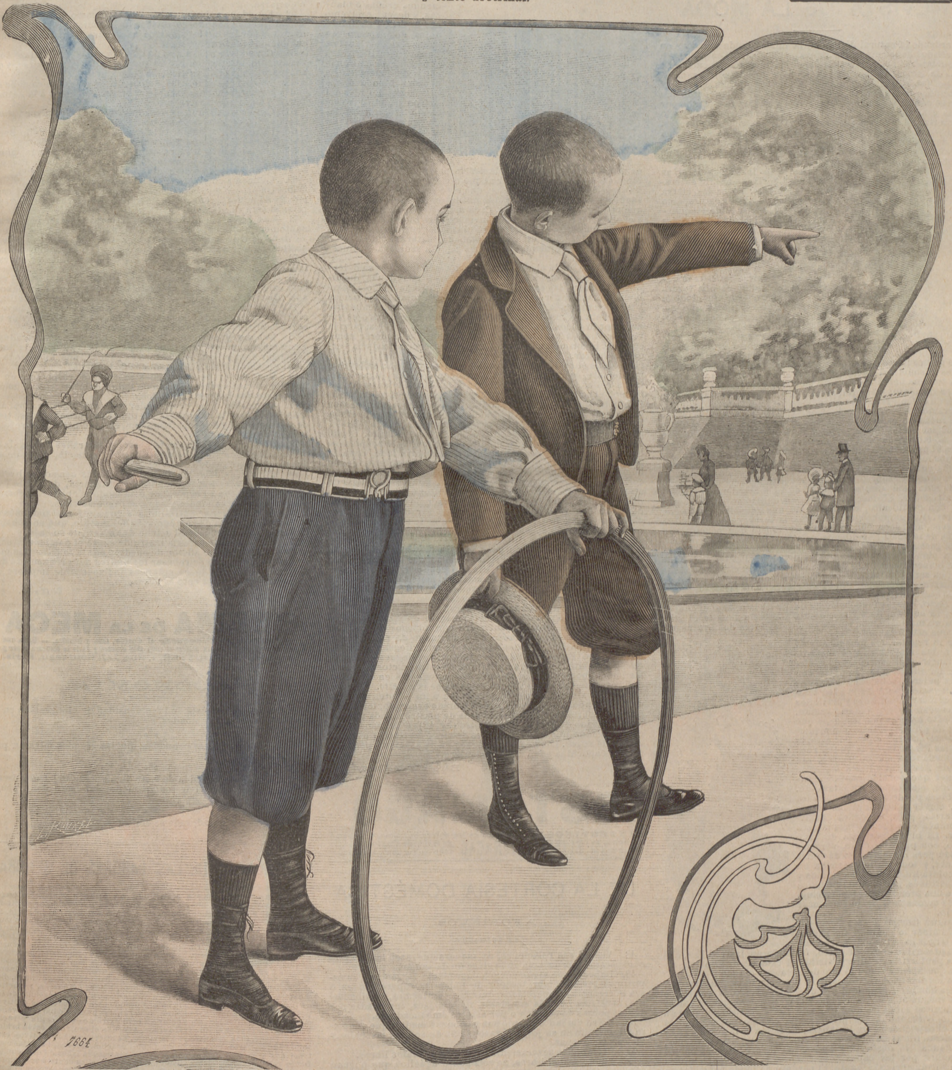
1. Trajes para niños.

SUSCRIPCIÓN 6 Meses. 1 Año. En toda España. 4 pts. 7'50