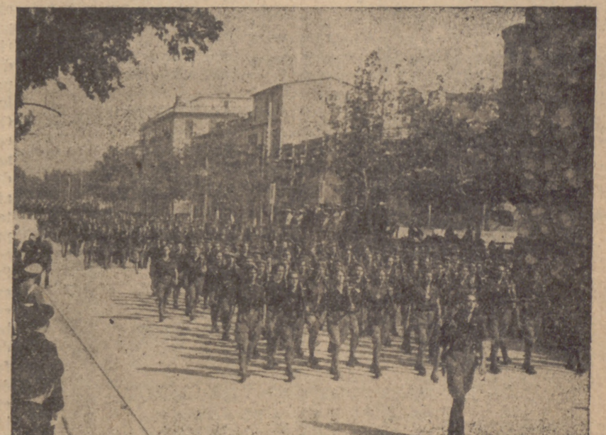
DESFILAN MARCIALMENTE LAS FUERZAS DE LA CAMISA AZUL