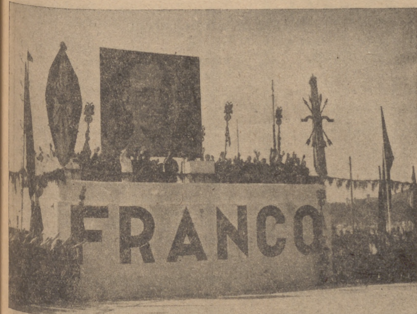
TODOS, BRAZO EN ALTO, ES CUCHAMOS LOS HIMNOS