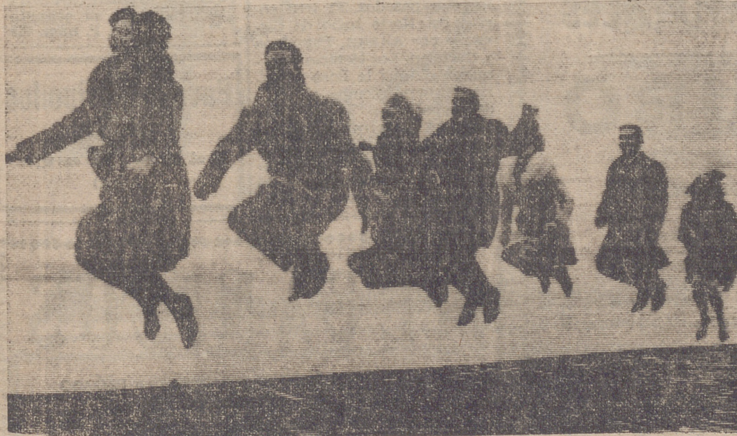
Hacia mucho tiempo que no se creaba una nueva danza. Pues bien, ésta es la «chapolka» el más novísimo baile. Es una mezcla de polka y cha-cha-chá. El autor de la coreografía es el alemán Gerd Haddrich y la música de la «Chapolka» número 1 de los compositores Straesser y Werner Tawber. Cuatro parejas ensayaban los distintos pasos en el muelle del puerto de Hamburgo, y la primera dama pierde un zapato.