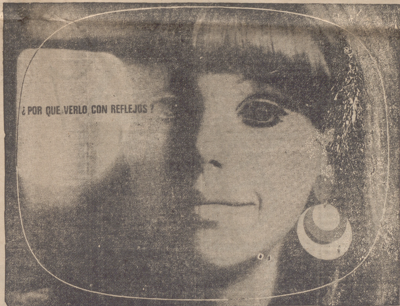
¿POR QUE VERLO CON REFLEJOS?