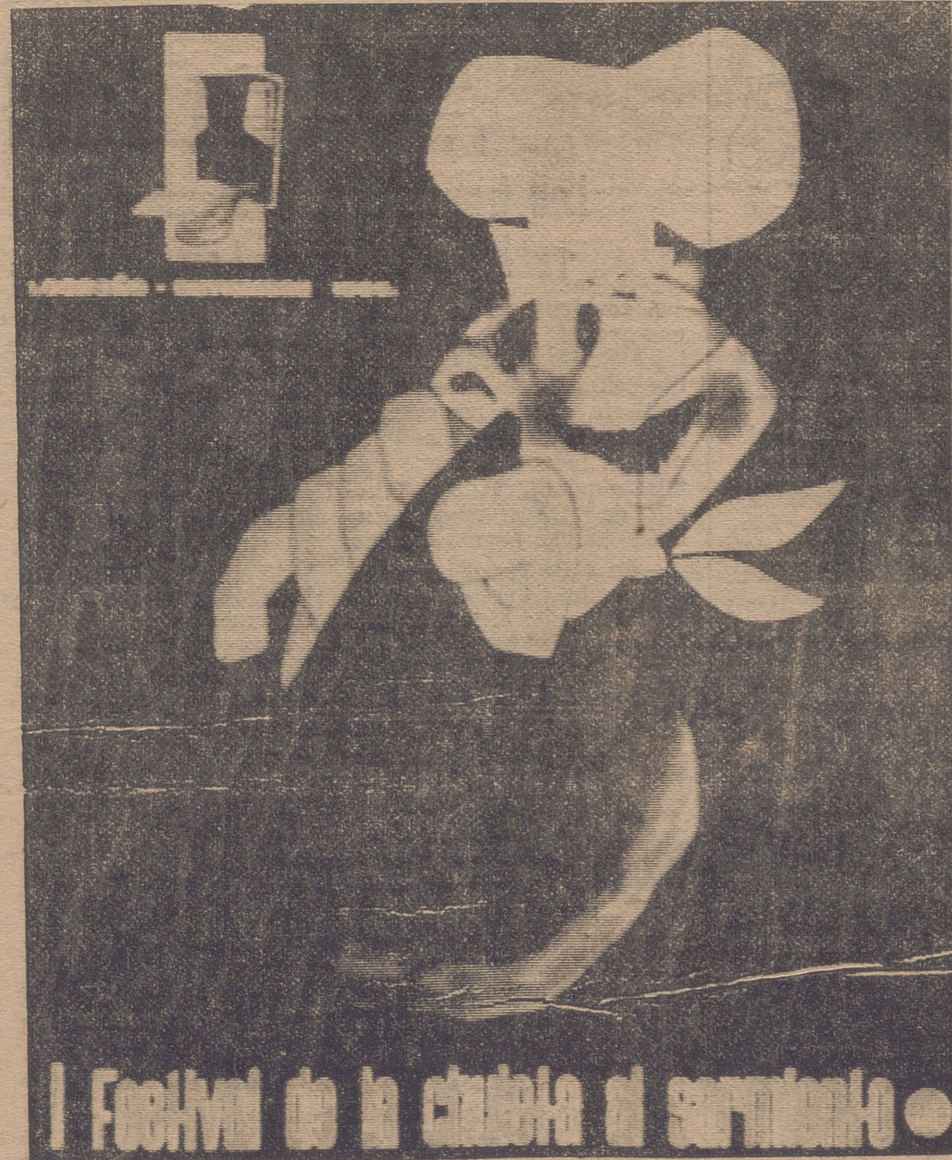
Original cartel del no menos original Festival de la Chuleta al Sarmiento que se celebrará en Logroño en las fiestas de San Mateo. (En la página tercera, bases del concurso)