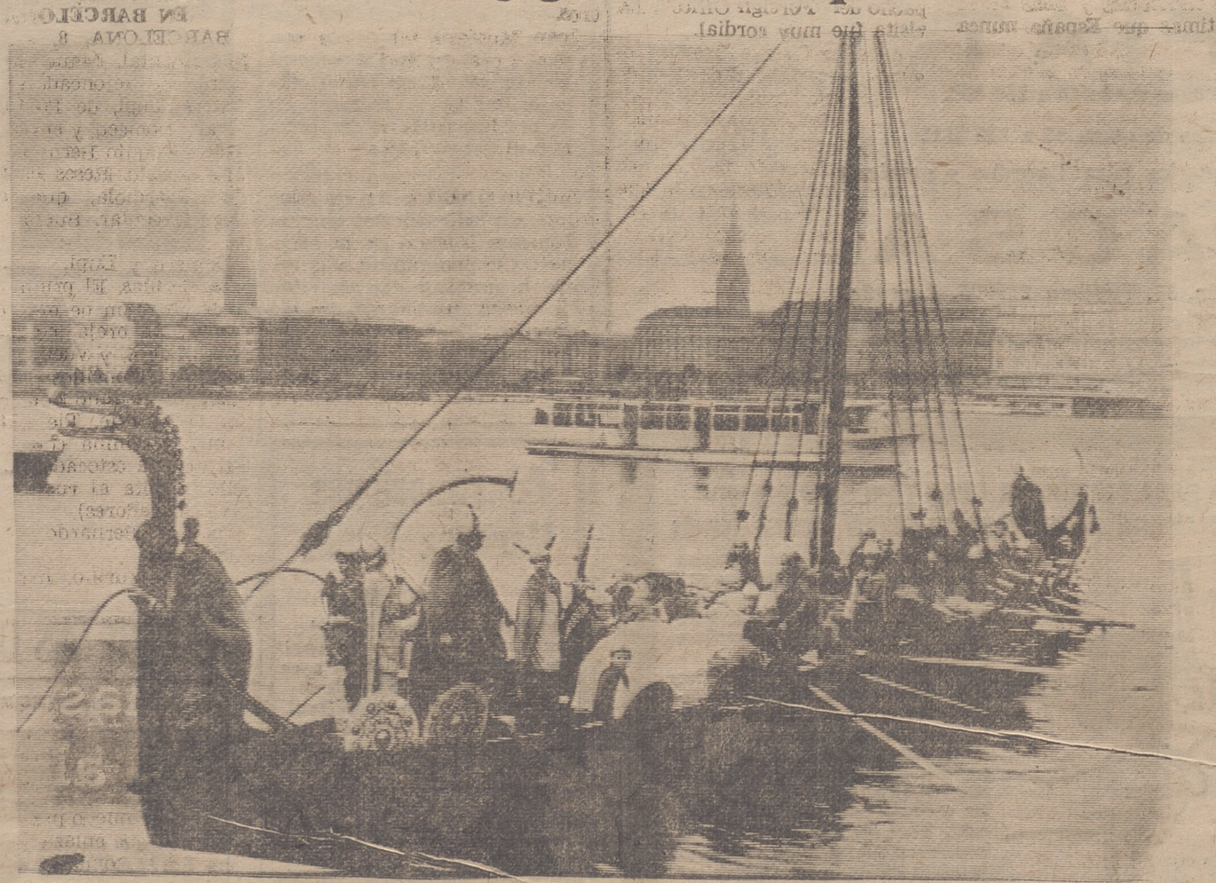
Un gigantesco queso danés, destinado a la Feria de Artículos Alimenticios que se celebra en la ciudad alemana de Hamburgo, es transportado hasta aquí en una nave de vikinkos, cuya presencia contrasta con la de las modernas embarcaciones. (Fototele).