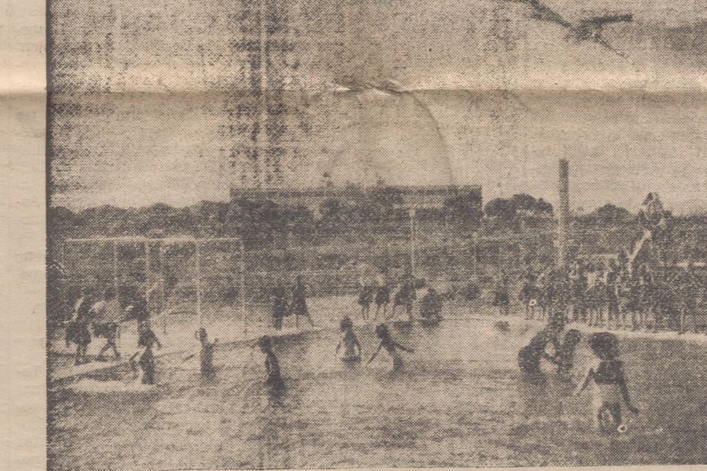
Colonia infantil de Santa María del Mar en Comarruga (Tarragona)

No pretendemos, aparte de ese recordatorio, hacer aquí una relación exhaustiva de la labor que esta Caja de Ahorros desarrolló en todo ese tiempo. Podemos señalar únicamente, como curiosidad de cifras, que cuando en 1876 se cerró el primer ejercicio, el número de impositores con que la Caja contaba era de DOSCIENTOS DIEZ, con un capital de TREINTA Y CUATRO MIL CUATROCIENTAS PESETAS, y que cuando ahora examinamos la reciente Memoria, vemos en su balance la cifra de DOCE MIL QUINIENTOS TREINTA Y DOS MILLONES SE-