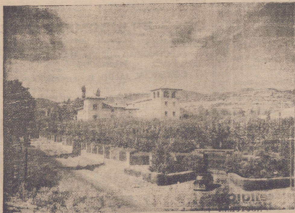
La colonia infantil Nuestra Señora de Valvaquera en Nalda (Logroño)

Con motivo de este noventa aniversario que la Caja celebra, ha tomado el acuerdo de premiar económicamente las impositores que desde cien pesetas en adelante se realicen en este día en las respectivas Libretas de Ahorro.