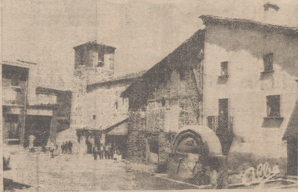
La iglesia, la escuela y fuente de la plazuela "Vicente Fernández Lacalle", en Castroviejo.