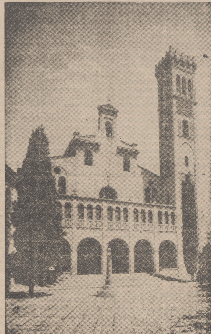
Casa de Economía Rural de Nuestra Señora de Cogullada, en Zaragoza

Por ser tan nuestras, no precisaríamos recoger aquí las realizaciones que la Caja nos ha ofrecido ni hacer referencia a las que todavía piensa llevar a cabo en nuestro suelo. Patentes están