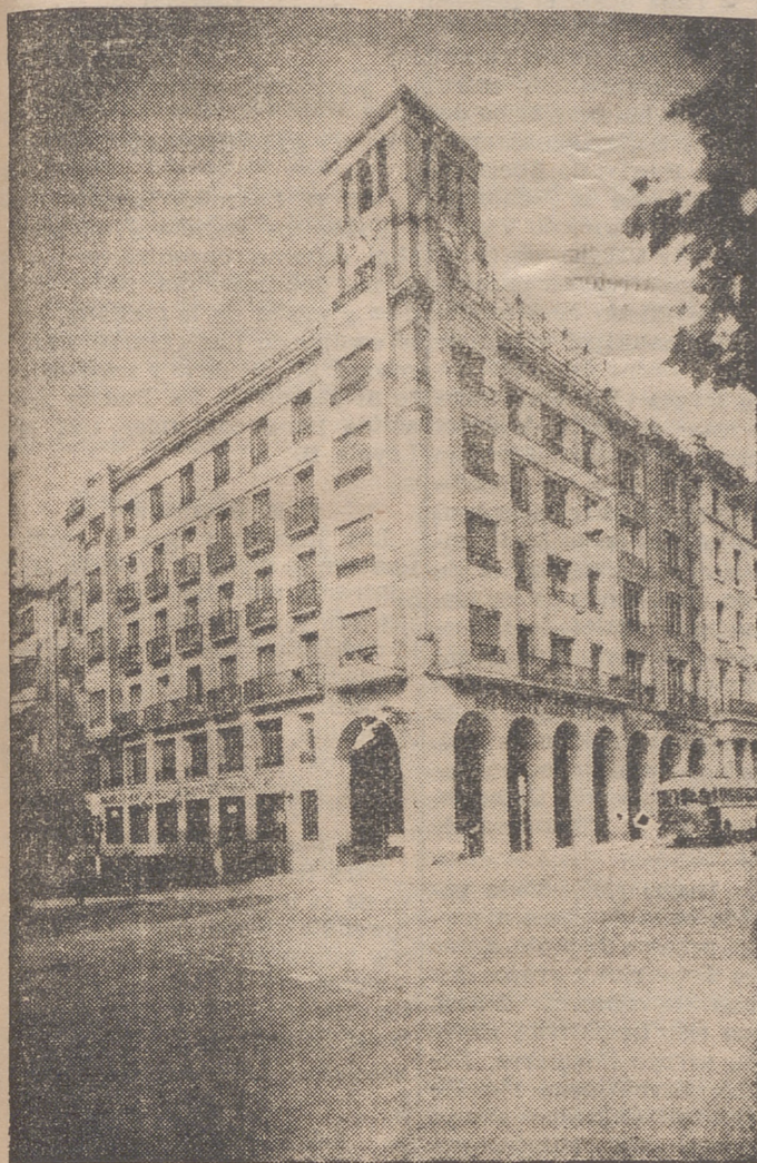
Edificio de la Subcentral de la Caja en Logroño

labor en la Casa Cuna del Niño Jesús, en la Guardería del Camino del Cristo, en la espléndida Colonia de Nal-