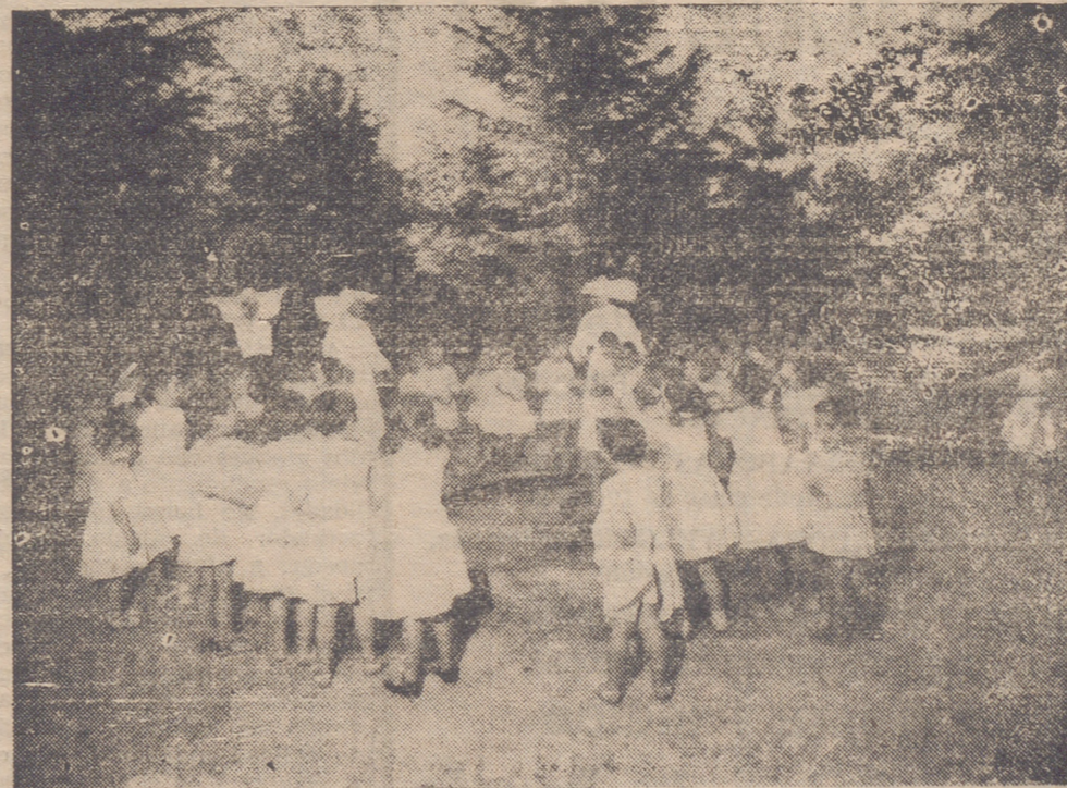
Los niños de la Casa Cuna del Niño Jesús en la Guardería infantil del Camino del Cristo (Logroño)