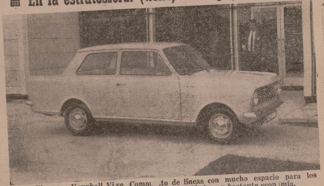
El nuevo Vauxhall Viva. Comp. to de líneas con mucho espacio para los viajeros y para equipajes. Alcanza gran velocidad con bastante economía.

Nos encontramos ante otro "Salón del Automóvil". Earls Court está repleto de modelos 1963-64 no sólo ingleses, sino alemanes, checos, franceses, italianos, suecos y rusos. Esta es la 48 exposición o "Motor Show" organizada por la Sociedad de Fabricantes y Comerciantes del Automóvil. Nuestro veredicto: muy interesante.