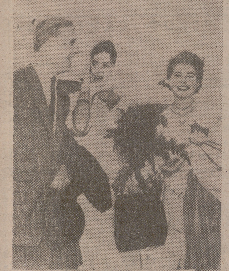
ESTOCOLMO. — La princesa Birgitta de Siemarinén Rega, acompañada de su marido, al castillo de Solider, en la isla de Oland, para pasar unos días de descanso.