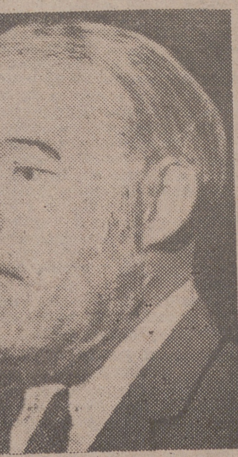
murió al nacer el hijo de ambos.

En aquellas escuelas jugaba al fútbol, era uno de los primeros nadadores, editaba el periódico del colegio y fue elegido el "profeta de la clase". Muy poco antes de graduarse solicitó alistarse en el Ejército americano, siendo camillero de la Cruz Roja en la primera guerra mundial, enrolándose después en el Ejército italiano, en el que fue herido por la metralla de una granada, que le causó 200 heridas, especialmente en las piernas. Diez años más tarde publicará uno de sus mejores libros en relación con esta contienda: "Adiós a las armas". Obra muy desigual y a veces inmensamente inmoral, que cuenta los amores del voluntario americano Henry y de la enfermera Catherine Berkeley. Con un principio malo, se vigoriza al contarnos la recepción del hombre desesperado en la retirada de Caporetto y la deserción de Henry con su amante a Suiza, cuando ella