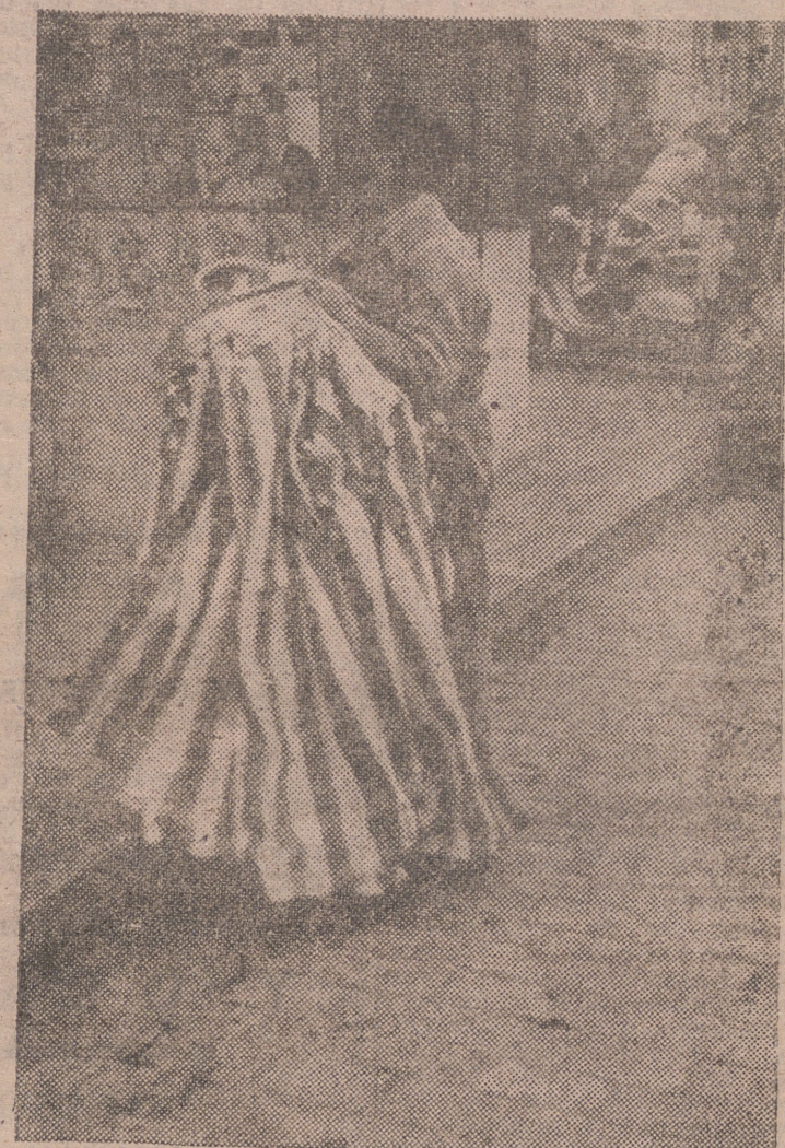
MADRID. — Obreros instalando banderas de España y de los Estados Unidos en la Avenida de José Antonio, por donde ha de pasar el presidente Eisenhower a su llegada a Madrid. — (Foto Cifra).