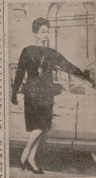
Un gracioso sombrero de terciopelo estilo turco. Un elegante lazo de moiré que recoge los originales fruncidos del cuerpo... La "princesa oriental" de Dior adopta un aire muy parisino al lado de este moderno automóvil.

En fin, no pretendo dar una lección técnica de maquillaje en un breve artículo periodístico, pues excede a mis posibilidades. Mi propósito no ha sido otro que el de hacer notar a mis lectoras la conveniencia de estudiar con el máximo cuidado este aspecto tan importante y decisivo del embellecimiento femenino.