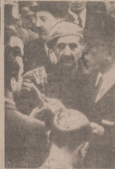
Grivas, el jefe de la EOKA, en Atenas

La llamada de socorro, hecha por los médicos que atienden al niño, fué recogida en Alemania, y pocas horas después el enfermo podía disponer de la medicina necesaria para su tratamiento. —(Efe).