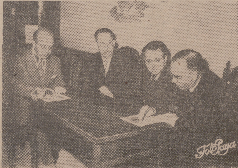
La presidencia durante el desarrollo del sorteo