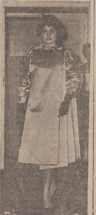
Abrigo de cocktail, de raso natural, color beige claro. La originalidad del modelo está en la línea recta de corte japonés. — (Foto Europa).

Trastornos digestivos o irregularidades.— Procurar el funcionamiento de nuestro cuerpo. El estreñimiento, por ejemplo, produce verdaderas catástrofes en la piel cuando se padece. Conviene consultarlo a un médico y ponerse en tratamiento inmediatamente. De la misma forma, cualquier trastorno o desequilibrio del tipo que sea.