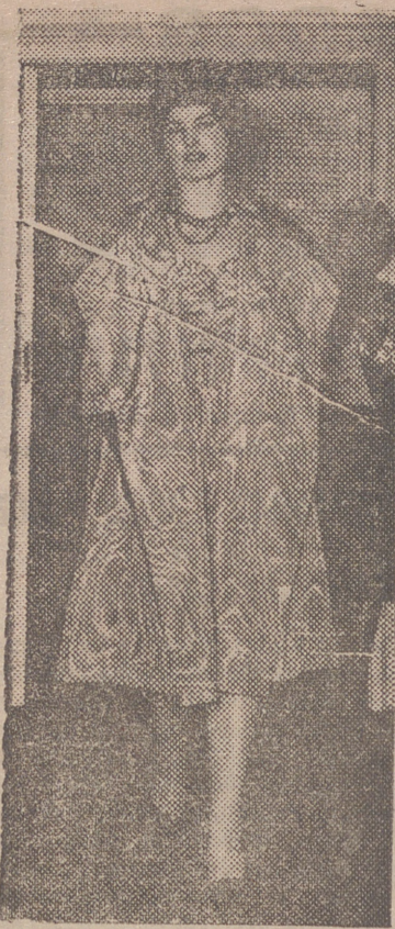
Conjunto de cocktail color malva, de género de moaré. El abrigo, de forma triada, con amplias vueltas que forman capelina, dan línea y elegancia al modelo. El acabado del tocado y collar completan la elegancia del conjunto.