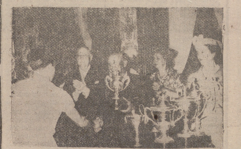
LA CORUÑA. — Su Excelencia el Jefe del Estado en el momento de hacer entrega de la Copa de su nombre al patrón de la trainera «San Juan», de Pasajes, ganadora de dicha prueba deportiva.