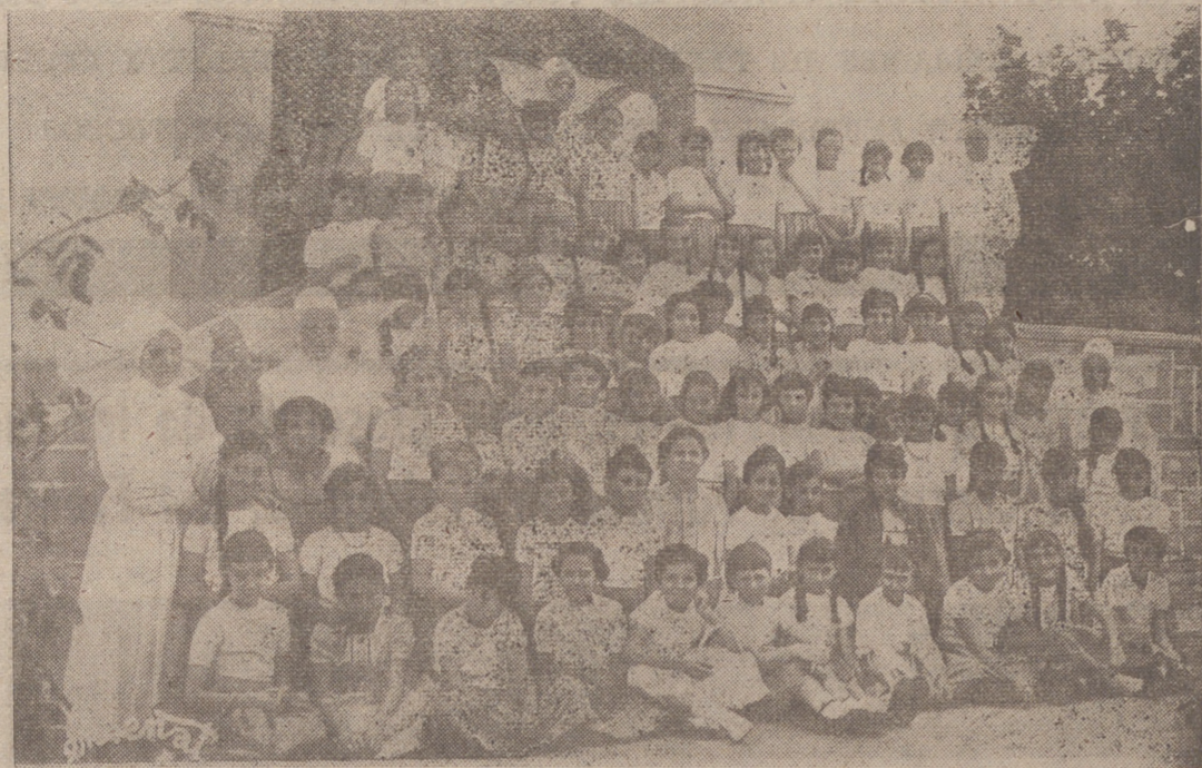
Foto que recoge a las 75 niñas que, atendidas por las 5 hermanas Hijas de la Caridad, forman el tercer turno que duraciones en la bellísima Residencia en Nalda, costada por la Caja de Ahorros y Monte de Piedad de Zaragoza, Aragón y Rioja, por cuya continuidad hacemos votos y cuyos frutos agradece mos a esta benéfica Institución.