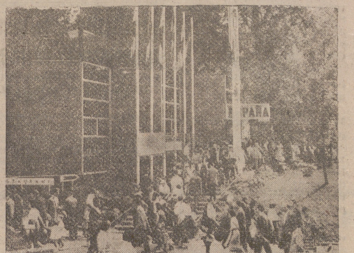
BRUSELAS. — Uno de los accesos al pabellón de España en la Exposición Universal e Internacional de Bruselas, mostrando la constante afluencia de público que lo visita día tras día.