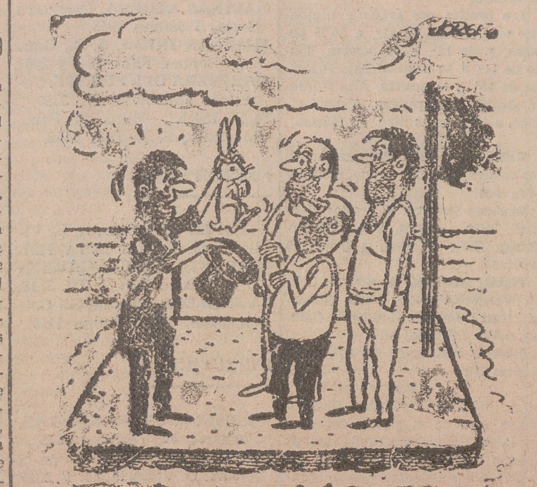
PRESTIDIGITADOR. —Caballeros... les advierto que éste es el último experimento.