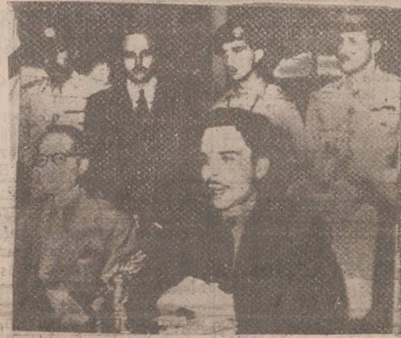
JORDANIA. — El rey de Jordania, Hussein, fotografiado durante su conferencia de Prensa celebrada en su Palacio de Amman, durante la cual dijo que había solicitado ayuda de tropas norteamericanas para reforzar a las británicas que ya se encuentran allí.