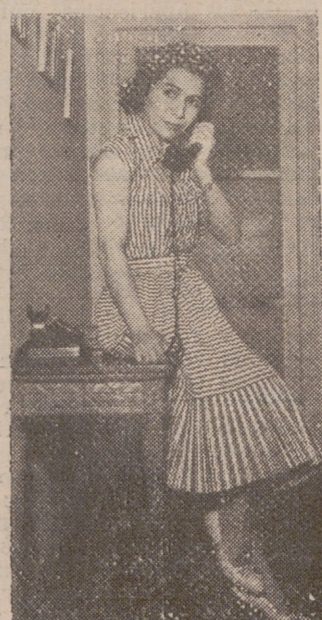
Marienna, la gran bailarina española que va a dirigir la escuela de ballet español y clásico del Teatro de la Zarzuela, de Madrid. (Foto «Europa»).

Marienna ha venido volando a Madrid y se ha puesto a preparar exámenes. Lo de volando, ha sido, naturalmente, en avión y nada menos que de Bruselas, y lo de los exámenes lo explicaremos luego. La gran bailarina acaba de organizar un magnífico ballet español para el marqués de Cuevas, ese gran «Méico» de nuestro siglo, que ha actuado con un éxito gigantesco en la Exposición Internacional de Bruselas. Lo de los exámenes es que Marienna tiene anunciados para fecha muy próxima unos cursos gratuitos de baile clásico y español, patrocinados por el Teatro de la Zarzuela de Madrid. Ya conocimos algo de esto en nuestra reciente entrevista con Lola Rodríguez de Aragón, directora del grupo lírico de la Zarzuela, y por eso hemos estado esperando la llegada de Marienna para que nos hablara de esta futura escuela de ballet. Marienna nos recibe en su piso lleno de fundas para todo, porque con esto de sus ausencias frecuentes casi no tiene tiempo de quitar y poner las fundas. Y santitas en un trazo enfundado y de cara a unas cortinas igualmente camufladas, Marienna nos ha dicho: —Cuando yo quise montar un ballet español en nuestra Patria tropecé con la gran dificultad de los bailarines. No hay bailarines preparados. Hay mucha gente que