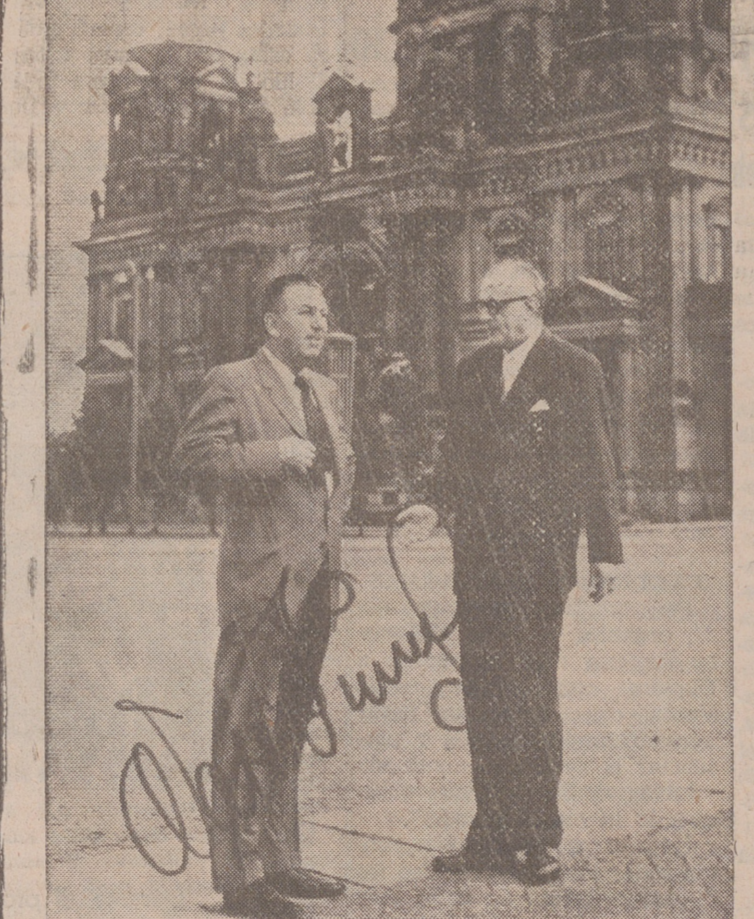
Walt Disney ha tenido la amabilidad de firmar esta foto para nuestros lectores. Al fondo, el Duomo de Berlín, en el sector oriental.

Se rumorea sobre la posibilidad de una película en Alemania