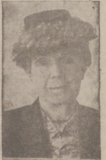
He aquí una de las últimas fotografías de la infanta doña Eulalia de Borbón, que ha fallecido en Irún a la edad de 94 años.

En el pútrido del panteón de reyes se encuentra igualmente el cadáver de la reina madre, la reina María Cristina, que el 6 de febrero de hace 29 años fué allí depositada y que se ignora cuándo podrá ser trasladada definitivamente