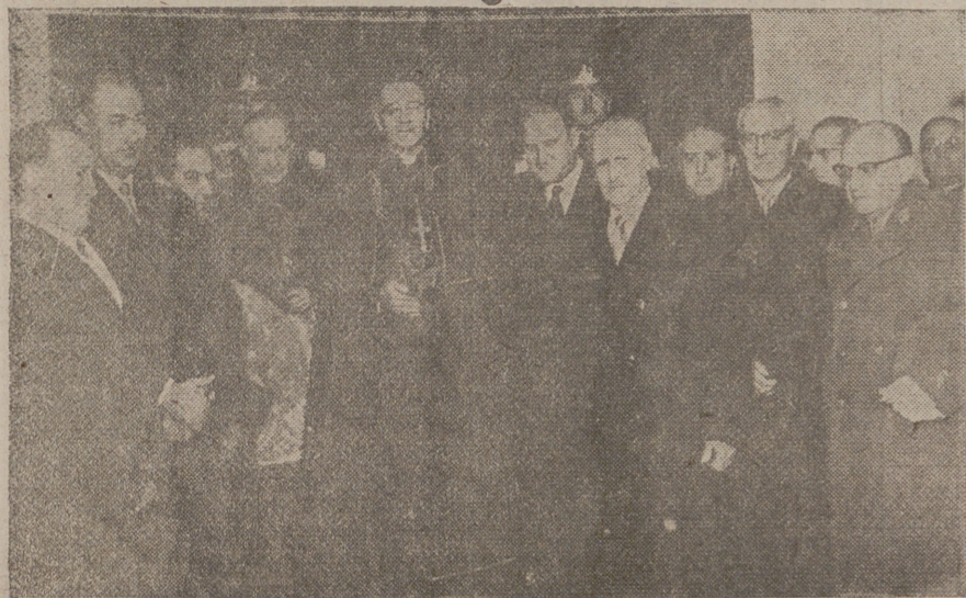
MADRID.—El nuncio de Su Santidad, monseñor Antonutti, acompañado del presidente del Consejo del Reino, varios ministros del Gobierno y otras personalidades, durante el besamanos celebrado en la Nunciatura con motivo de la celebración de la exaltación de Su Santidad Pío XII al solio pontificio.