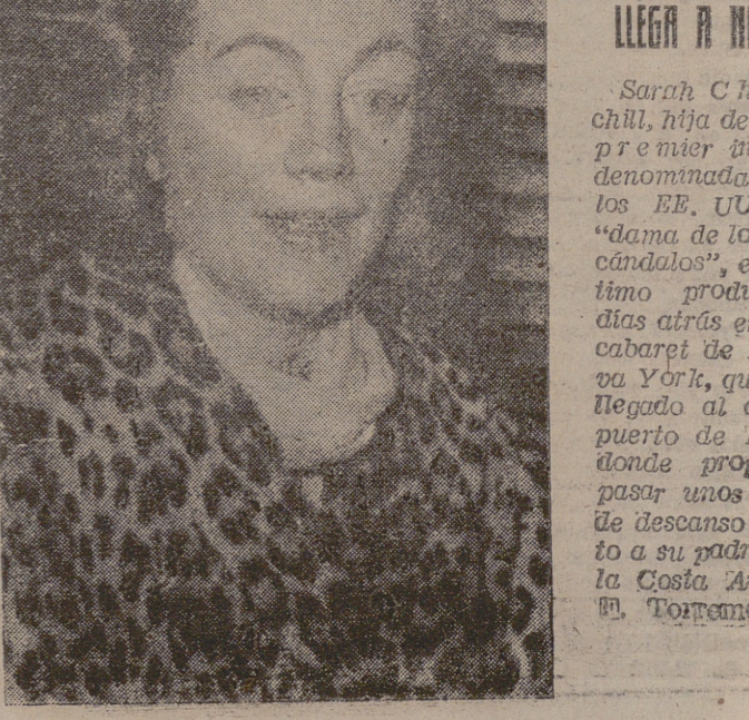
LA «DAMA DE LOS ESCANDALOS» LLEGA A NIZA

El tribunal ordenó al príncipe que pague 20.000 francos en concepto de indemnización al propietario de un hotel en donde se dice que el príncipe sustrajo mil francos.—(Efe).