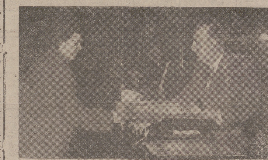
MADRID. —S. E. el jefe del Estado, acompañado del ministro de Educación, presidente del Consejo Superior de Investigaciones Científicas y otras personalidades, durante la entrega de premios con motivo de la clausura del XIV Pleno de dicho Consejo. (Foto Cifra).