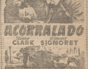
Las doce horas finales de un delincuente internacional!