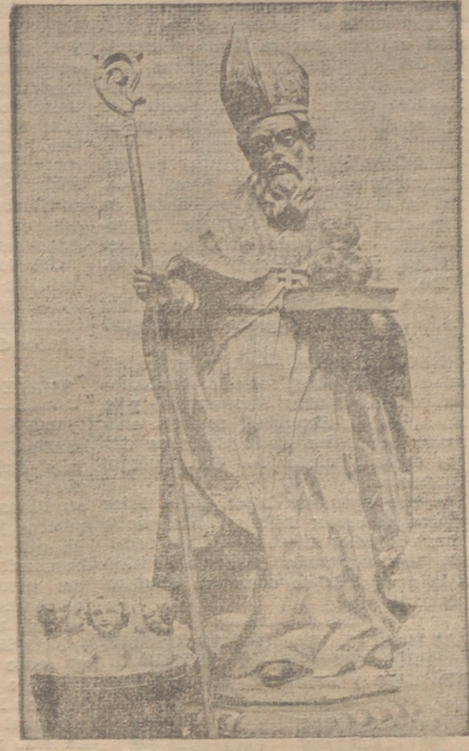
San Nicolás de Bari, artística y devota imagen que se venera en Santa María de Pa