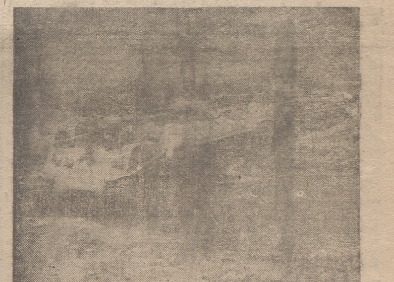
Unos tanques norteamericanos vadean un arroyo en Corea.

FAN MUN JOM, 8.—El general de división Henry Hodes manifestó, des pués de hora y veinte minutos de reunión durante la mañana, que se habían limitado a estar explorando. «Tratamos —dijo— de averiguar lo que significa la última propuesta comunista».