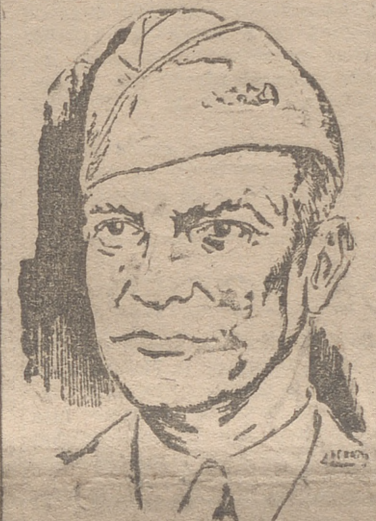
NUEVA YORK, 8.—El presidente Truman ha ofrecido al general

Pero en el cuartel supremo del general califican la información de "pura ficción"