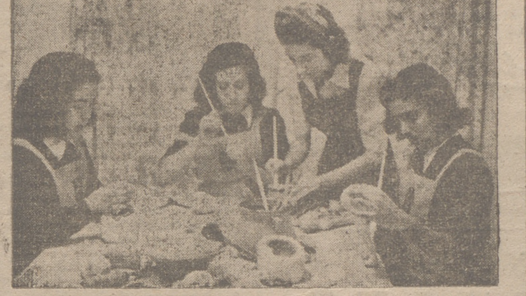
Juventudes de la Sección Femenina en un taller de capacitación profesional.

Nuestras niñas estudian, trabajan y juegan