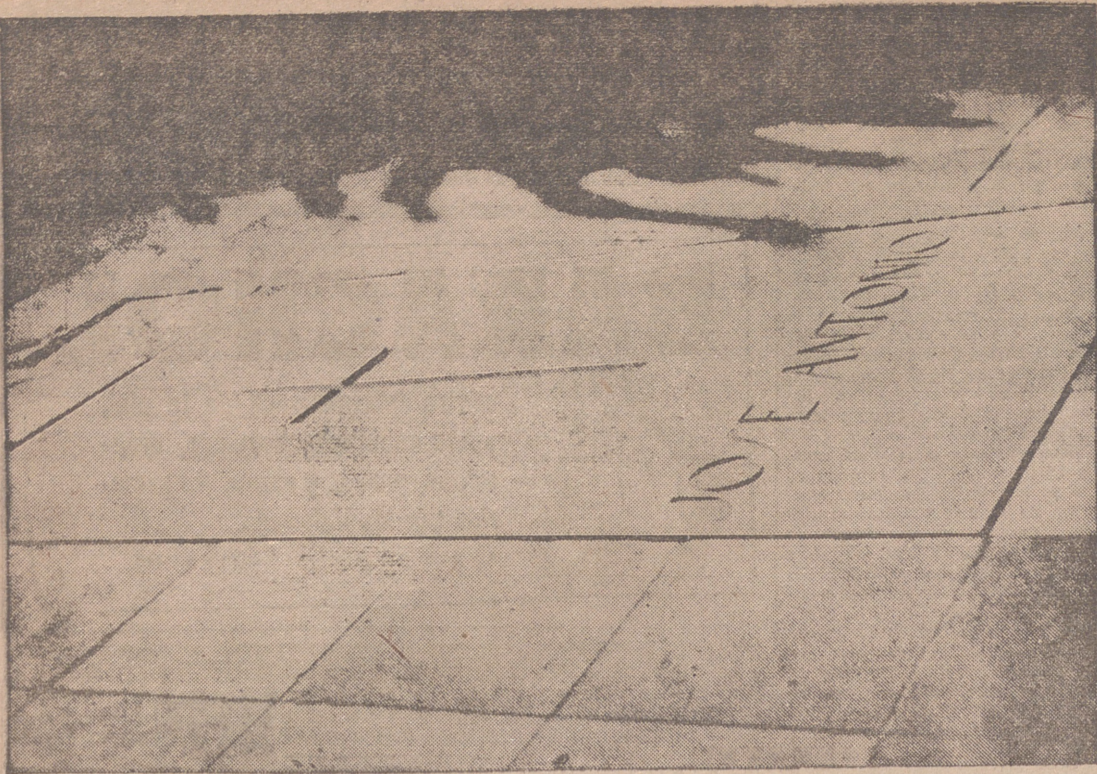
ENTRE LAS PIEDRAS HISTORICAS DEL MONASTERIO DE EL ESCORIAL, BAJO LA LOSA SENCILLA Y SEVERA, DESCANSAN LOS RESTOS DE JOSE ANTONIO. ALLI ACUDEN EN PEREGRINACION PARA ORAR POR SU ALMA, LOS FALANGISTAS DE TODA ESPAÑA. Y EL AMOR DE LOS ESPAÑOLES RENUEVA CONSTANTEMENTE SOBRE LA FRIA PIEDRA, LOS LAURELES Y LAS ROSAS SIMBOLICAS.