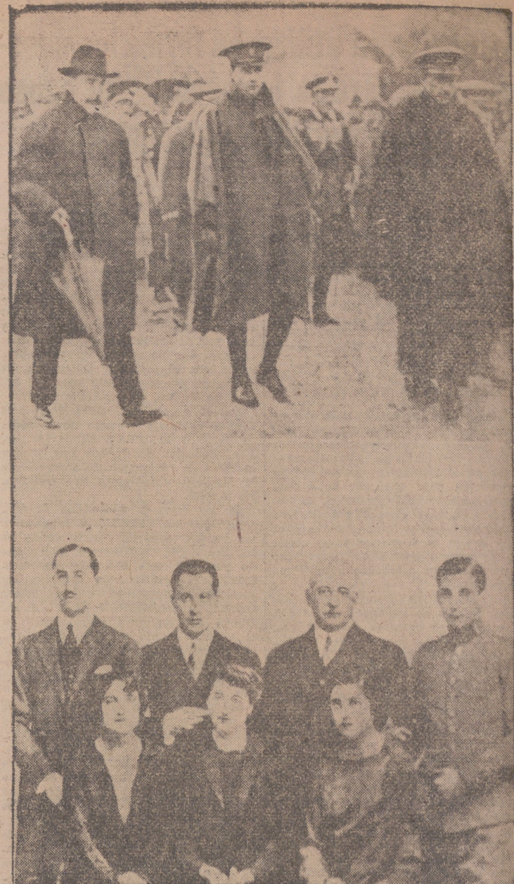
MIEMBRO DE UNA FAMILIA DE ESFORZADOS PATRIOTAS, ENCONTRO JOSE ANTONIO EN EL EJEMPLO DE SUS MAYORES LA SENDA DEL SACRIFICIO POR ESPAÑA. EN SERVICIO MILITAR, LO VEMOS EN EL PRIMER GRABADO PRESIDENDO EL DUELO EN EL ENTIERRO DE SU TIO DON FERNANDO, MUERTO GLORIOSAMENTE EN MONTE ARRUIT; Y EN EL DE ABAJO, EN COMPANIA DE SU PADRE, DON MIGUEL, QUE DIO A ESPAÑA SIETE AÑOS DE ORDEN, DE PAZ Y PROSPERIDAD Y ENTREGO TODAS SUS ENERGIAS POR LA PATRIA; DE SU TIA MARIA; HERMANAS, CARMEN Y PILAR, Y HERMANOS, MIGUEL, HOY MINISTRO DE AGRICULTURA, Y FERNANDO, ASESINADO POR LAS HORDAS ROJAS EN MADRID.