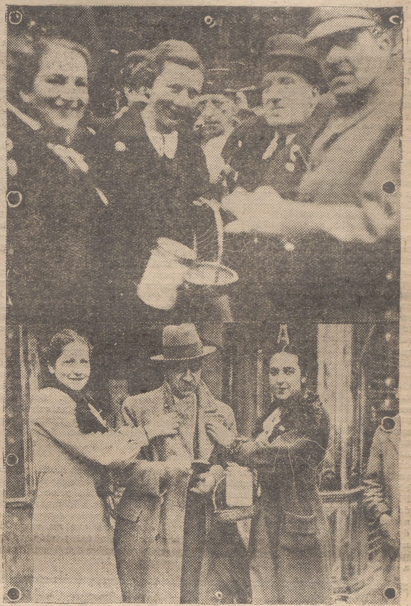
NOTAS GRAFICAS DE LA FIESTA DE LA BANDERITA VERIFICADA AYER. — ARRIBA, LOS SEÑORES GOBERNADORES MILITAR Y CIVIL CONTRIBUYENDO A LA CUESTACION.—ABAJO, DOS BELLAS SEÑORITAS POSTULANTES

La fiesta de la Banderita, como ya hemos anticipado, resultó un tanto deslucida, debido al tiempo que, por esta vez, no quiso coadyuvar a la abnegada labor que en la calle realizan nuestras bellas señoritas para lograr una lucida recaudación destinada a las humanitarias atenciones