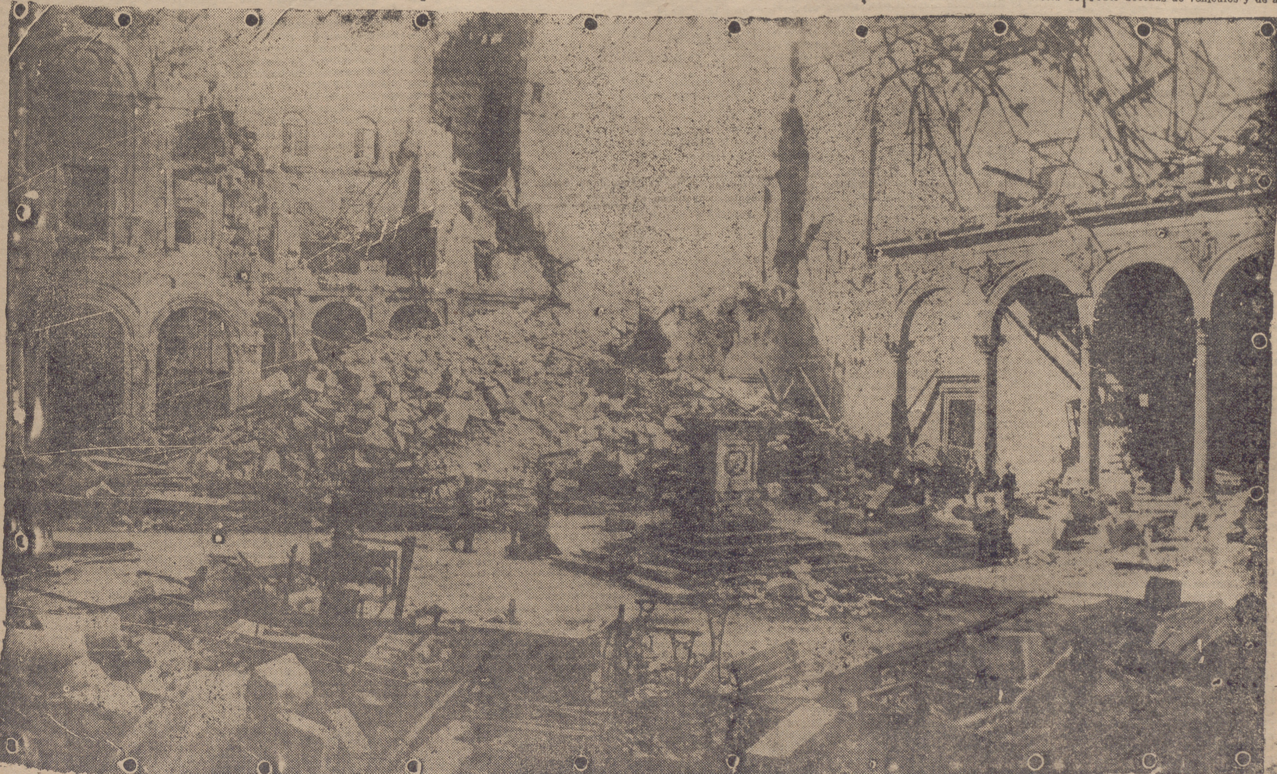
Vista del interior del Alcázar, en la que se pueden apreciar los destrozos causados por la dinamita, que abrió brecha en sus muros

Las huestes aguerridas del General Yagüe ocupaban la zona fluvial comprendida entre el Tístar y el Tajo, llevando la alegría de la liberación a docenas de pueblos indefensos y nobles hollados sin compasión por la pezuña asiática de los osos de Moscú. El día 29, a la hora del crepúsculo, cuando sienten los soldados coloniales la nostalgia fervorosa de las palabras del "muezn", cayendo sobre los aduares desde los altos minaretes de las alcázaras, las fuerzas Regulares salieron del pueblo de Barrocalejo en dirección bélica a Torrijos, villa importantísima que nuestro Ejército ocupó sin novedad. Por la mañana de ese mismo día, el Generalísimo Franco llegó con su Estado Mayor a Naval Moral de la Mata, celebrando un cambio de impresiones con Yagüe y otros jefes y oficiales sobre el terreno de las operaciones. El 30 de agosto de 1936, el nuestro laureado teniente coronel Tella, decidió ocupar Oropesa y Torralba, lo cual logró después de violentos tiroteos de las hordas anarco-marxistas del Frente Popular, las cuales no se resignaban de buen grado a perder posiciones tan importantes; mas, al fin, los rojos tuvieron que huir a la desbandada, dejando en nuestro poder docenas de vehículos y de ame-