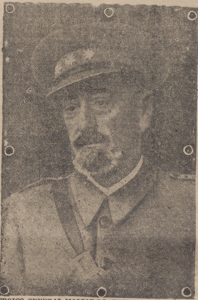
EL HEROICO GENERAL MOSCARDÓ, JEFE DE LOS DEFENSORES DEL ALCAZAR

El Alcázar de Toledo es hoy el más glorioso de nuestros mutilados. Su herida sangrienta dará a la Nueva España la más noble, la más honrosa de sus cicatrices, que son la ejecutoria de sus esclarecidas virtudes. La frase con que el coronel Moscardó dió la novedad al Generalísimo Franco, sublime en su sencillez, es para el escudo de la Patria la más significativa leyenda. También en la España que triunfa, que se recobra y que afirma su destino imperial, sobre el sacrificio está la victoria y la victoria le es tan debida a su heroísmo que en la España digna que trabaja, que lucha, que sufre y que vence: "No hay novedad". ¡Arriba España! ¡Viva el Ejército Español! ¡Viva el Caudillo! ¡Viva el General Moscardó!