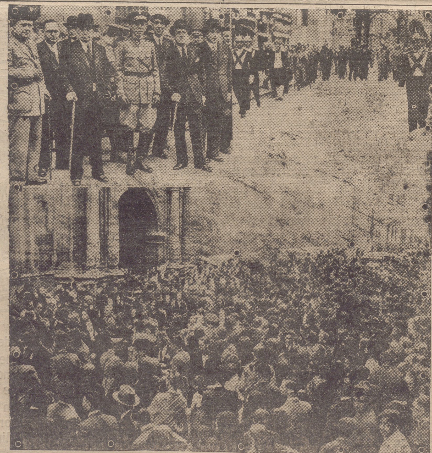
DE LOS FUNERALES POR EL ALMA DEL INVICTO GENERAL MOLA, CELEBRADOS AYER EN ESTA CAPITAL.— ARRIBA: EL AYUNTAMIENTO DIRIGIÉNDOSE A LA COLEGIATA Y LAS AUTORIDADES QUE PRESIDIERON EL ACTO. ABAJO: MOMENTO DE INICIARSE LA SALIDA DE LA IGLESIA, EN EL QUE SE HACE NOTAR LA GRAN CANTIDAD DE PERSONAS QUE, POR HABERSE LLENADO EL TEMPLO NO TUVIERON ACCESO A EL.

¡Viva el General Mola! ¡Viva el Ejército Español! ¡Viva el Generalísimo Franco! ¡Viva España! ¡Viva siempre España!—A. Gil.