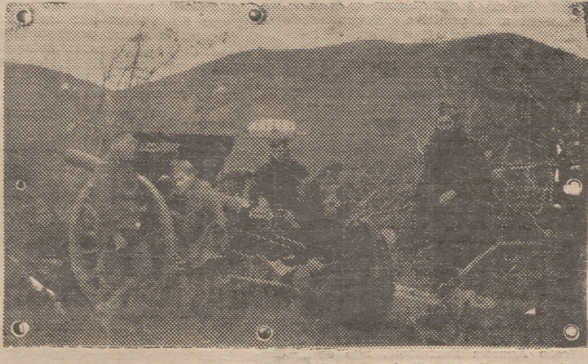
tría. Y todos, al saludarnos con un ¡Feliz Año Nuevo! y ¡Viva España!, formulamos nuestros votos fervientes por el rápido triunfo de esta Cruzada salvadora.

Sigue retumbando de montaña en montaña el estampido de cañones y morteros, al que forman caja enorme de resonancia las profundas honomatadas. Por fin, nuestras baterías, mudas hasta entonces, a la voz de