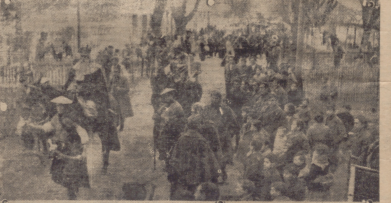
LA CABALGATA DE LOS REYES MAGOS EN LOGROÑO.—ARRIBA: MONARCAS Y SU SEQUITO A SU PASO POR UNA DE LAS CALLES. — ABAJO: ENTRADA EN EL PATIO DEL ASILO PROVINCIAL, DONDE ES RECIBIDA POR LA ALEGRE ALGARABIA INFANTIL.

Eran la señal de nuestra fuerza arrolladora, eran la voz potente de la España que representa la Justicia y el Orden, eran la afirmación estruendosa de nuestra ya próxima y definitiva victoria sobre gentes insensatas que pretendían arrebatararnos nuestra fe en Dios y nuestro amor a la Pa-