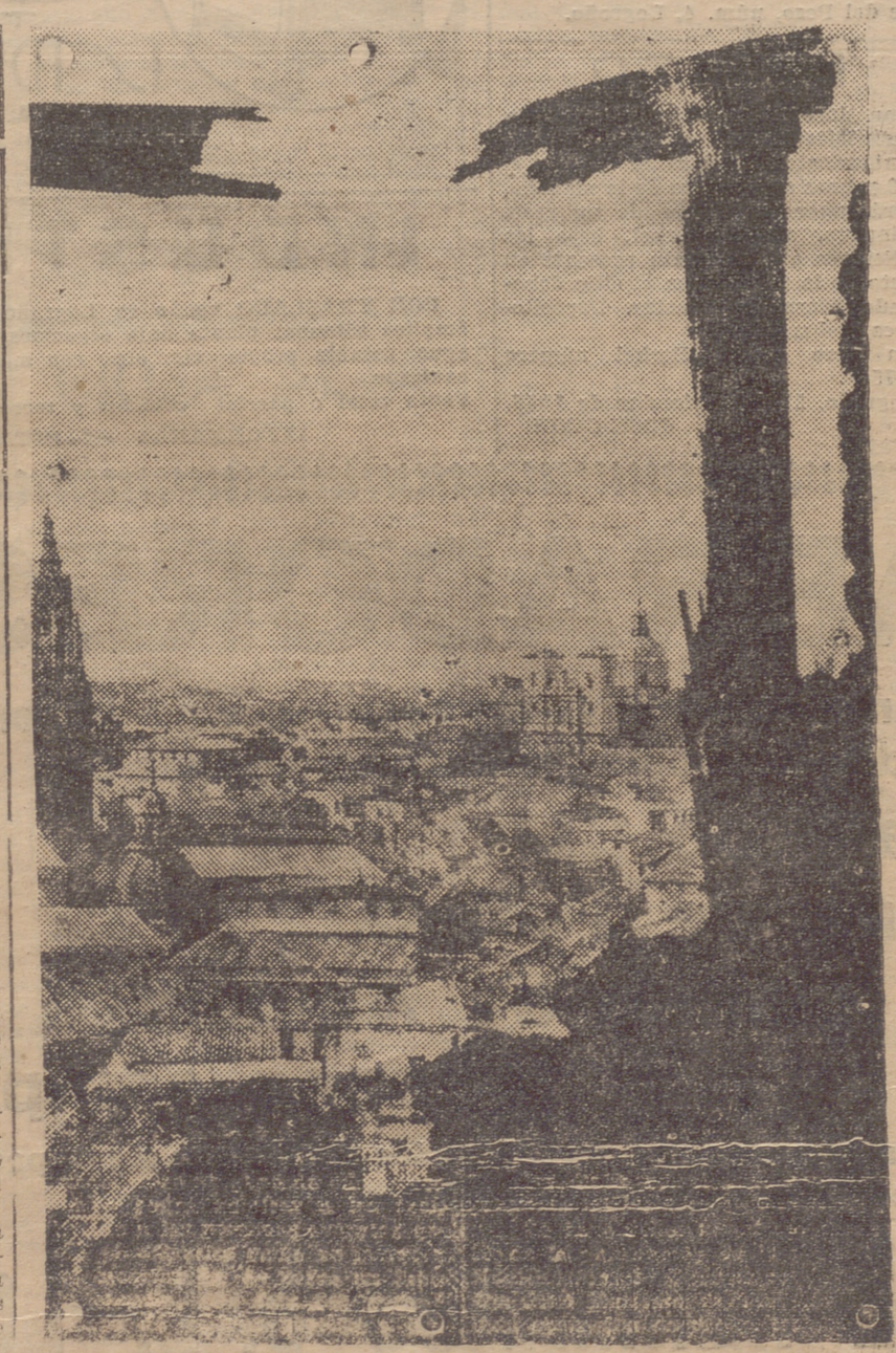
VIENDO EN LOS DESGARROS DEL ALCÁZAR, EL OBJETIVO DE LA MAQUINA FOTOGRAFICA TOMA INDEBEMENTE UNA VISTA DE TOLEDO

Plaza de Zocodover: Punto de cita y reunión de forasteros. Quedo perplejo al contemplarla. En la fachada sudoeste, una casa que ha sufrido los efectos de la mocha. A la derecha de su planta baja, el españolísimo Café Español. Al sur lo que en sus tiempos fué "Gran Hotel Imperial". Hoy un enorme montón de escombros. Frente a él queda en pie un arco de triunfo que es símbolo de triunfo. En el espacio que tenemos: "Plaza de Zocodover".