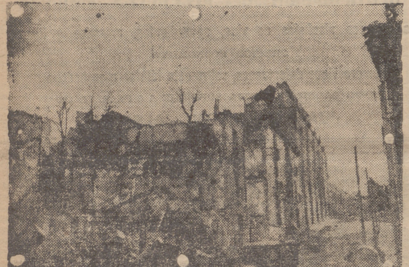
ESQUELETO DE LO QUE FUE BANCO HIPOTECARIO Y DONDE SE FUE EL ROTULO DE "CUARTEL GENERAL DE LA F. A. I. Y C. N. T. PRIMER OBJETIVO DE NUESTRA ARTILLERIA