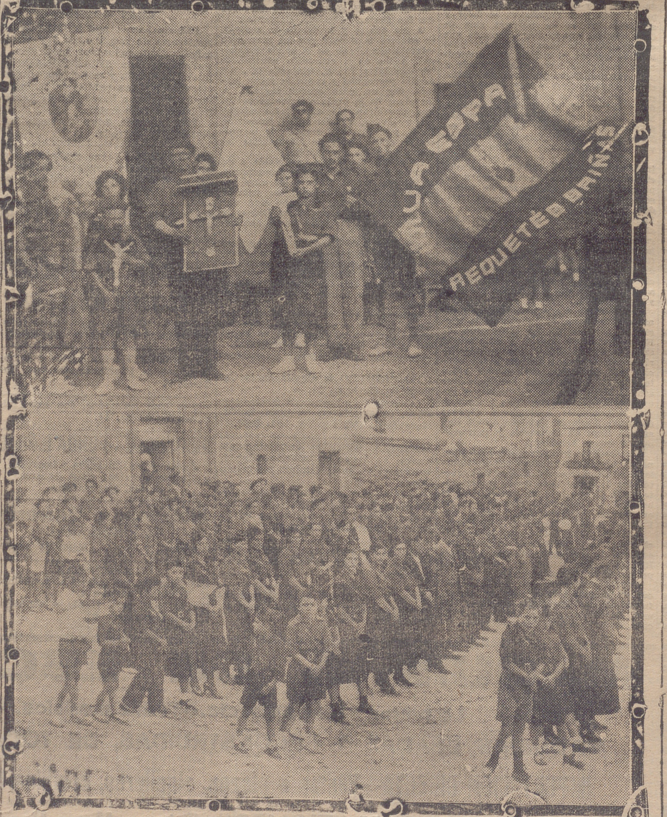
CON ENTUSIASTICA CONCURRENCIA Y GRAN DESFILE, SE DELEBRO EL ACTO DE COLOCAR LOS CRUCIFIXOS EN LAS ESCUELAS Y AYUNTAMIENTO. — LAS MILICIAS ESPERANDO A LA SALIDA DE LA IGLESIA DONDE FUERON BENDICIDOS LOS CRUCIFIXOS