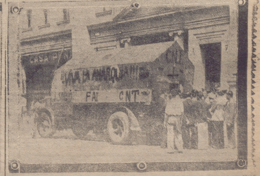
UN CAMION MARGADO CON LAS INICIALES DE LAS ORGANIZACIONES ROJAS COGIDO POR LAS FUERZAS NACIONALES