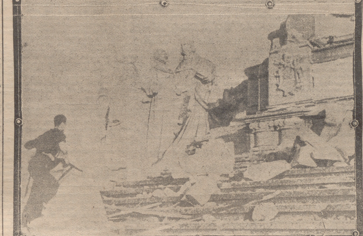
DOS MOMENTOS DEL VANDALICO Y SACRILEGO ATENTADO QUE PERPETRARON LOS ROJOS CONTRA EL MONUMENTO AL CORAZON DE JESUS DEL CERRO DE LOS ANGELES, HECHO BARBARO E IMPIO QUE MOTIVO UNANIME MOVIMIENTO DE EXALTADA PROTESTA Y QUE SERA OBJETO DE CASTIGO Y REPARACION CUMPLIDAS, POR LA JUNTA DE DEFENSA NACIONAL (De la "Ilustración Francesa")

de la Corporación. Del gremio, porque el jefe de la producción no será en adelante sólo el capital, sino el trabajo, que deberá estar en condiciones de lograr de cuantos concurren a aquella, las colaboraciones necesarias y de concurrir él mismo, en forma que no especulen los demás sobre sus retribuciones. Y de la Corporación, mediante la agrupación de todos los elementos definidos por una actividad económica, en torno al interés defensa de la producción misma y bajo la égida de un Estado nacional.