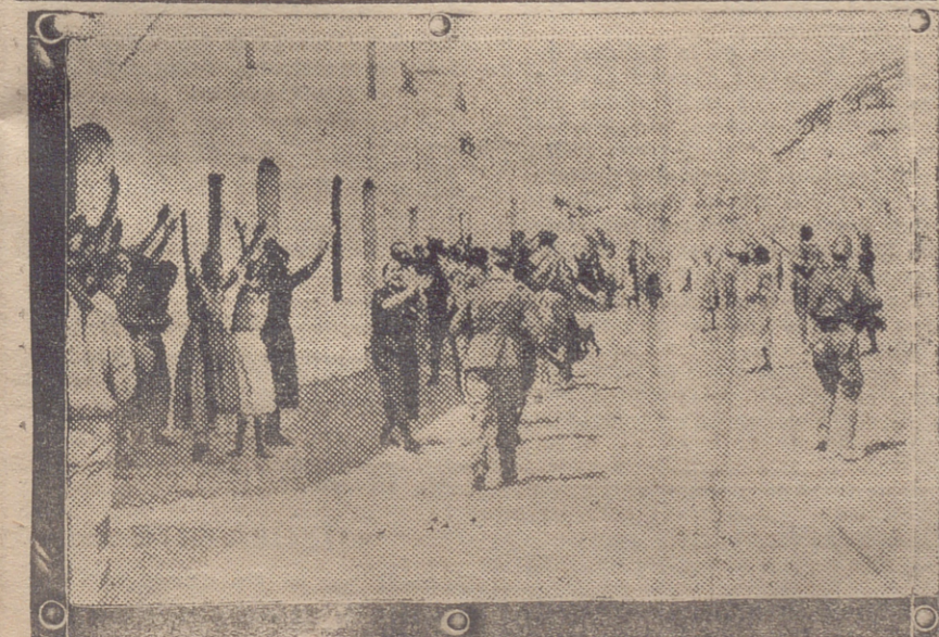
ENTRAN EN UN PUEBLO DESALOJADO POR LOS ROJOS ENTRE LOS APLAUSOS Y OVACIONES DE LAS MUJERES

cha y resolución de los problemas de cada actividad, bajo la presidencia y el control de un Estado coordinador y nacional. Sólo de las grandes catástrofes surgen los grandes ímpetus creadores. A una época agitada, moribunda y sin horizontes, que tuvo por signo y calamidad la falta de quehacer y trabajo porque habían muerto en su seno todas las ilusiones, va a suceder un siglo de fiebre constructiva. Con las ruinas que provocan las horrias marxistas, Dios nos prepara la tarea de una época, en la que la paz tendrá toda la alegría y la emoción de una creación constante y todo el aliento heroico y militar de esta lucha, que sirve para merecerla.