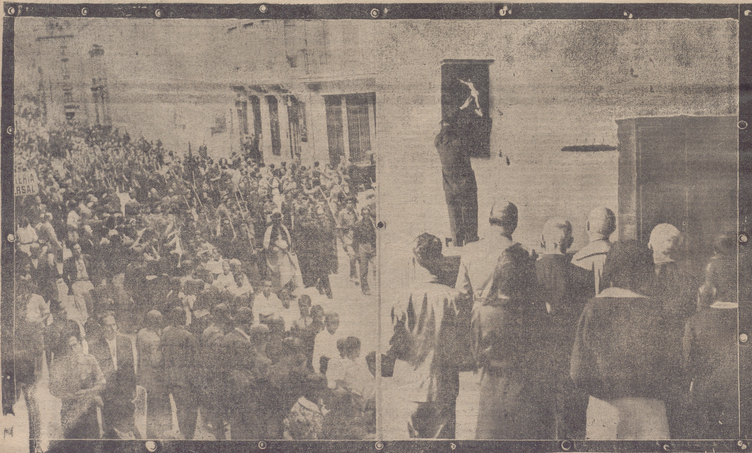
A LA IZQUIERDA: UN ASPECTO DE LA PROCESION. — A LA DERECHA: MOMENTO DE COLOCACION DE UNO DE LOS CRUCIFIJOS