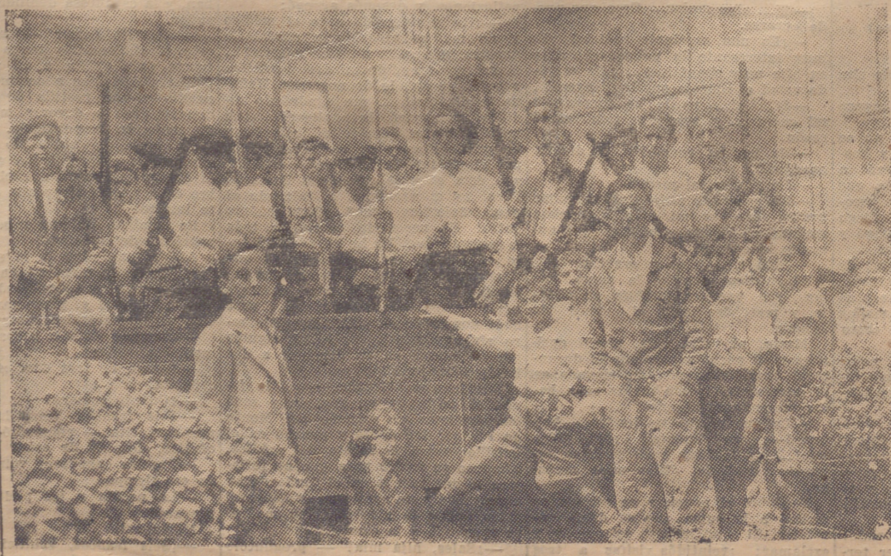
DE DISTINTOS PUEBROS FUERON A HARO NUMEROSOS VOLUNTARIOS PARA AYUDAR A LAS FUERZAS EN SUS EXCURSIONES POR LA RIOJA ALTA