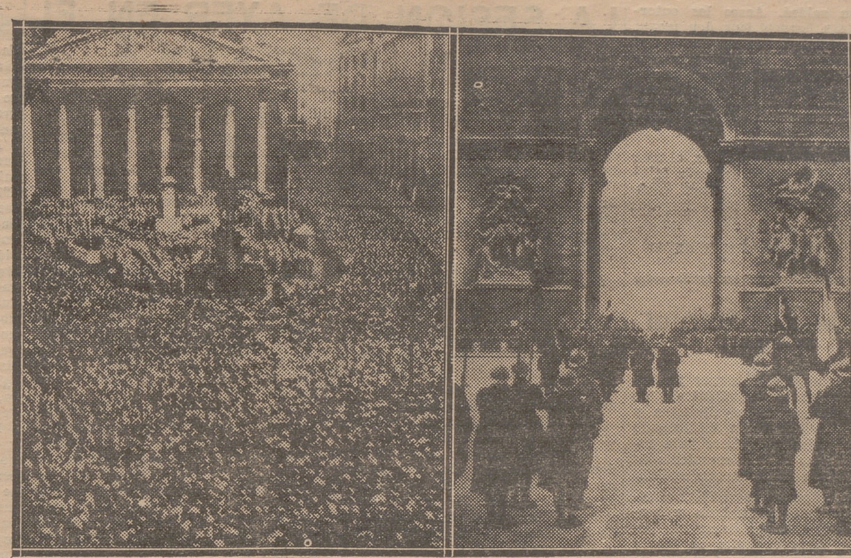
LA CONMEMORACION DEL ARMISTICIO.—IMPONENTE MANIFESTACION EN LONDRES. LAS TROPAS ANTE EL ARCO DEL TRIUNFO, EN PARIS, BAJO EL QUE REPOSA EL SOLDADO DESCONOCIDO

Se ha denunciado un intento de asalto a los locales de Falangé Española.