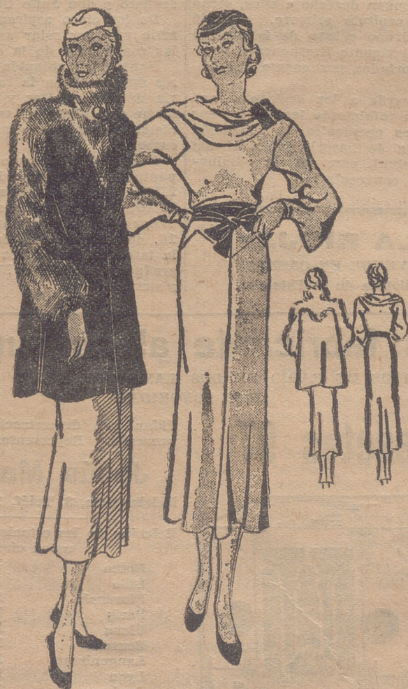
Abriego ancho "tres cuartos", de terciopelo negro. Cuello y mangas mangán de nutria. — Traje de crepe negro, banda drapada de terciopelo coral adorna el escote. Cinturón también de dicho terciopelo.

Hablemos ahora un poco de peinados, para terminar este artículo. En primer lugar, diremos que la nuca queda al descubierto para dar al perfil mayor carácter y ligereza. El