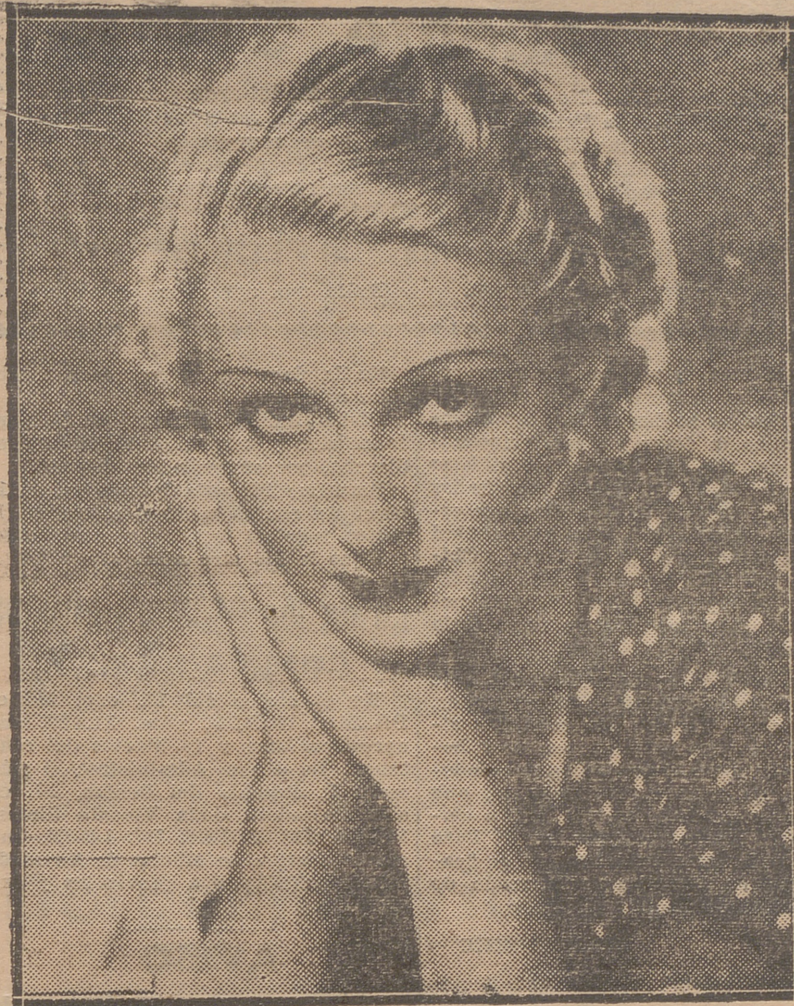
ANNIE DUCAUX, NOTABLE ACTRIZ DE LA PANTALLA FRANCESA

a la mesa de la Cámara un expediente de la Compañía Africa Oriental, que desarrolla sus actividades en la Guinea.