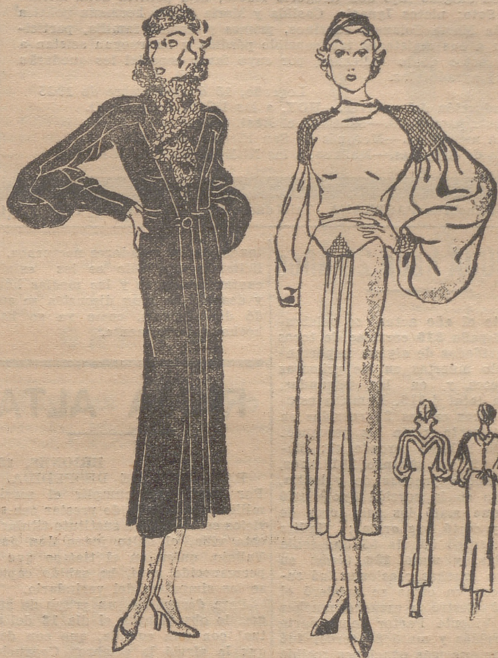
Abriego de paño negro, adornado por cortes, mangas ranglán. Cuello de astrakán gris claro terminado en una chorrera. — Traje de crepón mate verde. Unos frunces montan las mangas ranglán muy anchas en la parte inferior. El efecto de los frunces se encuentra en la delantera de la falda

Los productos para suprimirlas rápidamente, en PERFUMERIA VIUDA DEELIZONDO