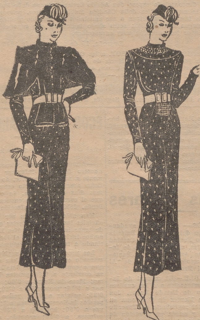
Capa de nutria clara. Traje de lana negra bordado con triángulos de plata, escote con cordones de seda blanca y cuello de oficial. Cinturón de ante blanco. Un grupo de frances da anchura a la falda por delante.