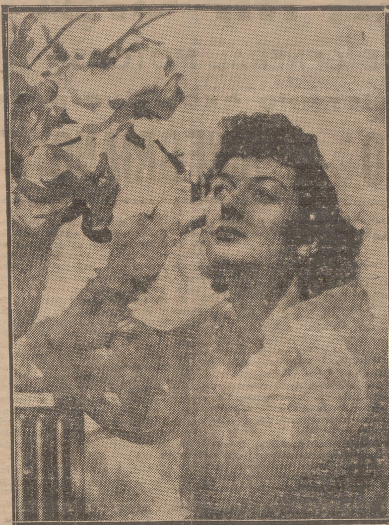
ROSALIND RUSSELL, DE LA "METRO"