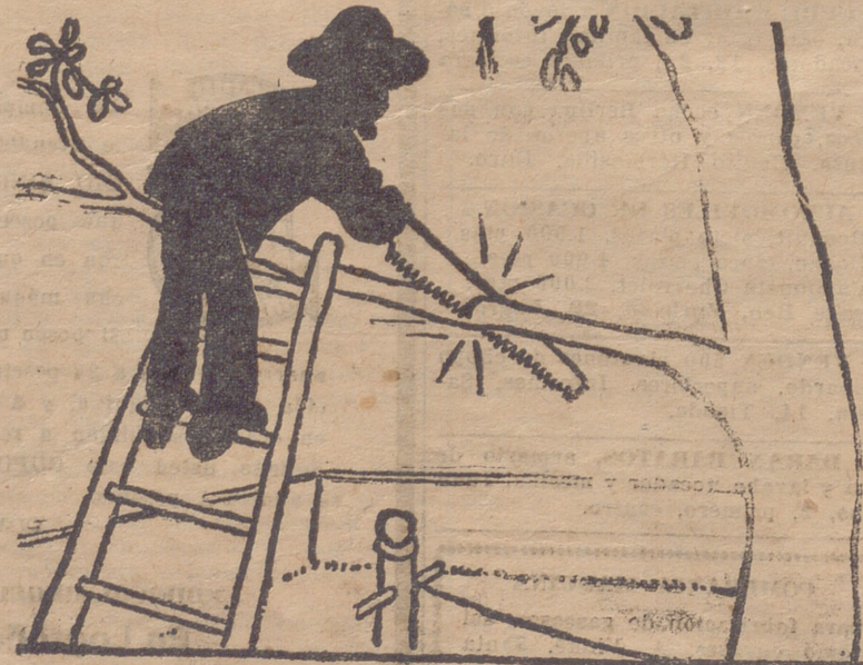
—Ahora no dirán que pongo mal la escalera para cortar las ramas.

Crucero a Tierra Santa, Egipto y Grecia, del 31 de agosto al 15 de septiembre, que efectuará el transatlántico "Roma", de 30.000 toneladas.