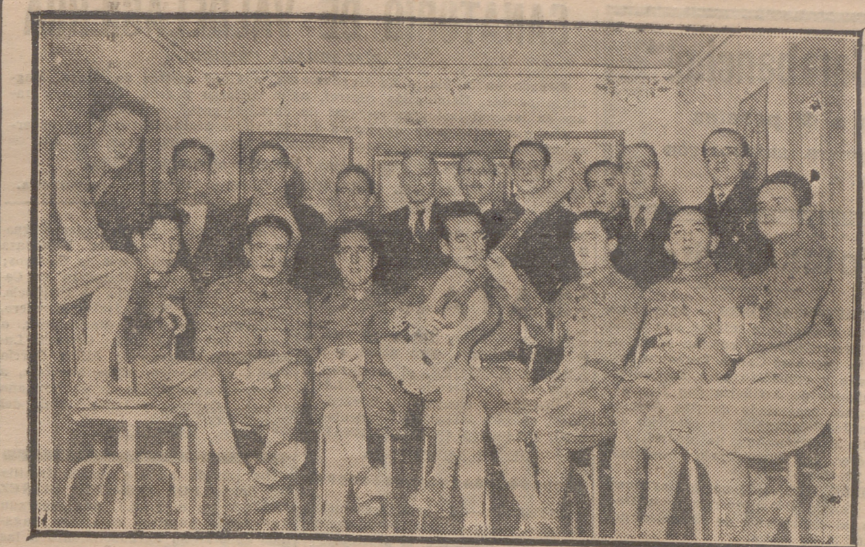
SOLDADOS RIOJANOS OBSEQUIADOS POR LA COLONIA RIOJANA DE BILBAO CON MOTIVO DE LAS PASADAS FIESTAS DE NAVIDAD

El mismo periodista interrogó después al señor Cierva, que esta misma noche ha regresado a Londres.