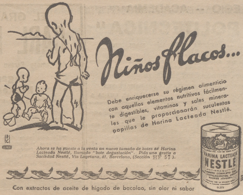
Ahora se ha puesto a la venta un nuevo tamaño de botes de Harina Lactada Nestlé, llamado "bote degustación". Pida uno gratis a Sociedad Nestlé, Via Lagetana, 41. Barcelona, (Sección HF 57).