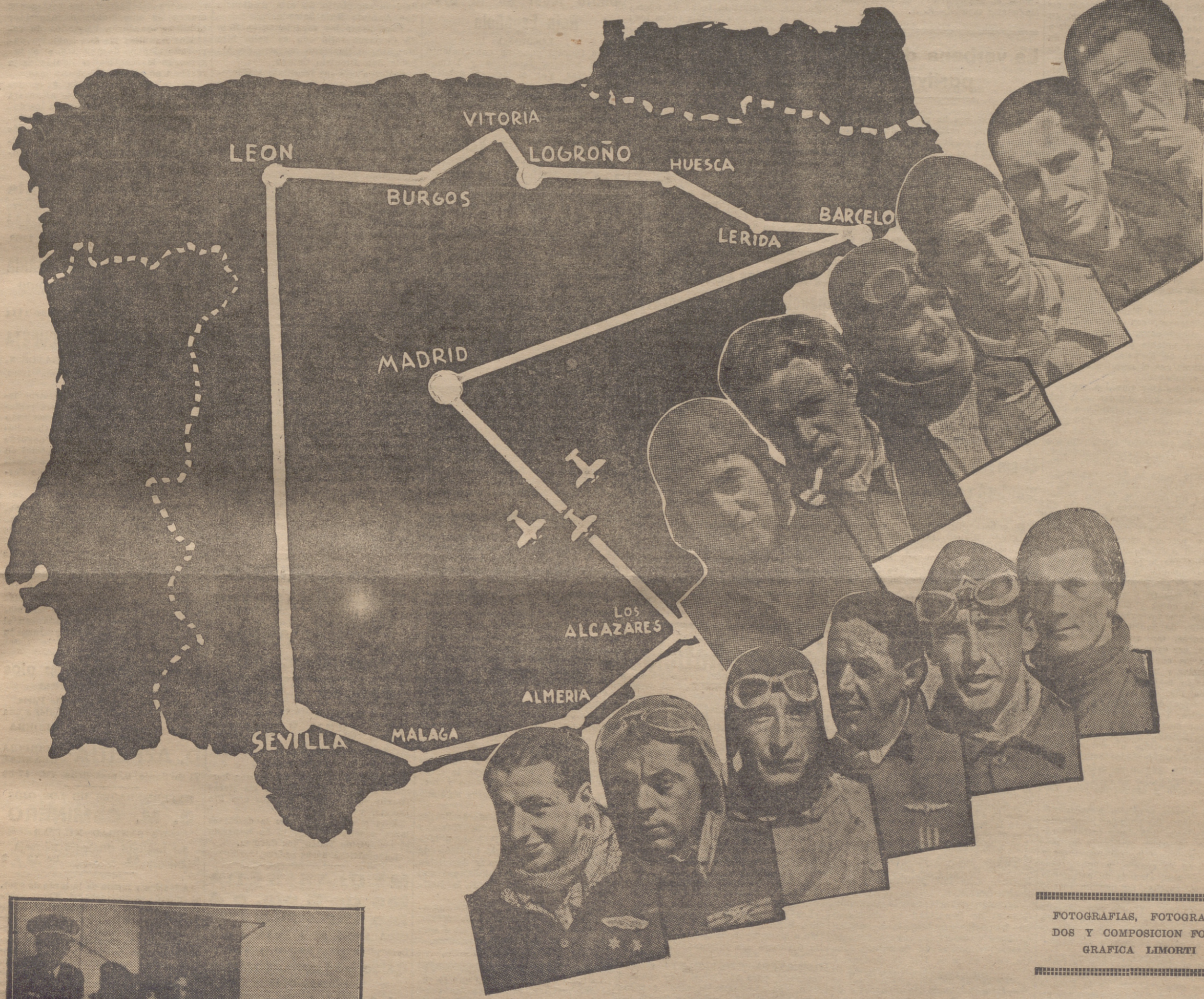
FOTOGRAFIAS, FOTOGRAFADOS Y COMPOSICION FOTOGRAFICA LIMORTI