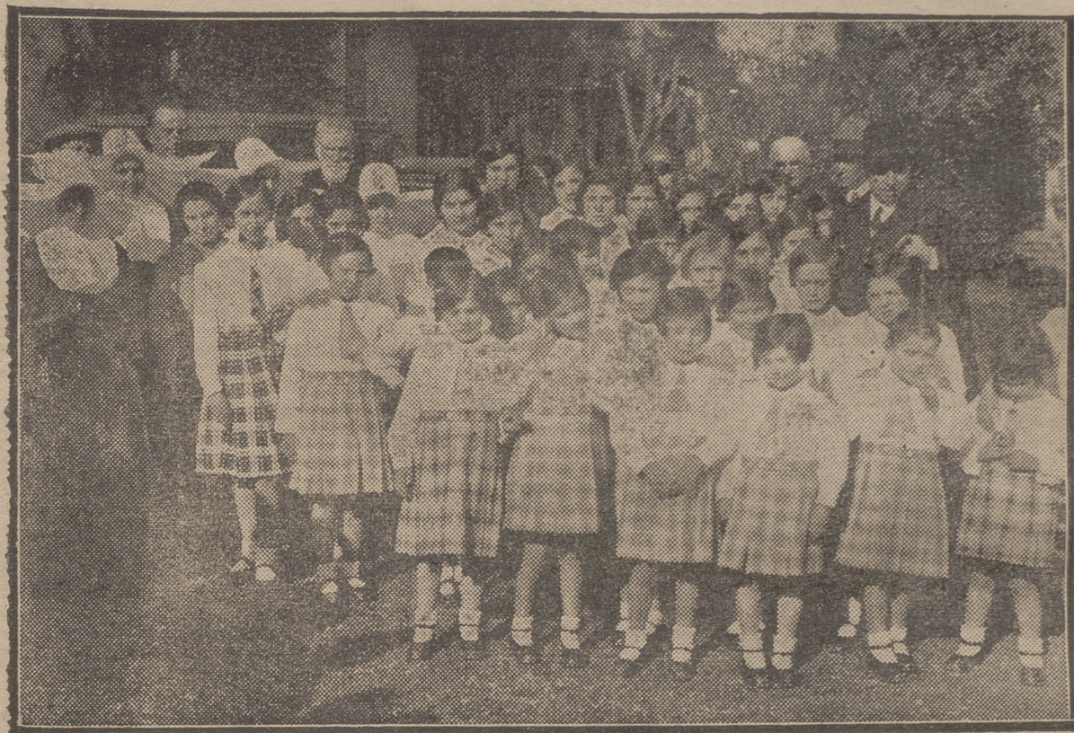
ALGUNAS DE LAS AUTORIDADES Y LOS GRUPOS DE NIÑOS Y NIÑAS DEL ASILO, QUE TOMARON PARTE EN LA FIESTA