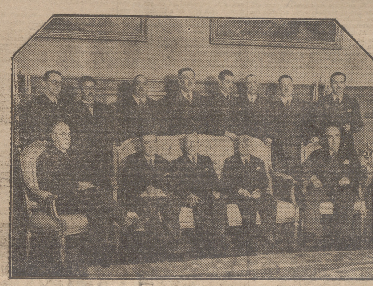
EL NUEVO GOBIERNO QUE AYER SE PRESENTO A LAS CORTES.

El señor PRIETO:—La gravedad de los momentos hace que nos preocupemos de una manera objetiva, sin reparar en contactos con las mi-