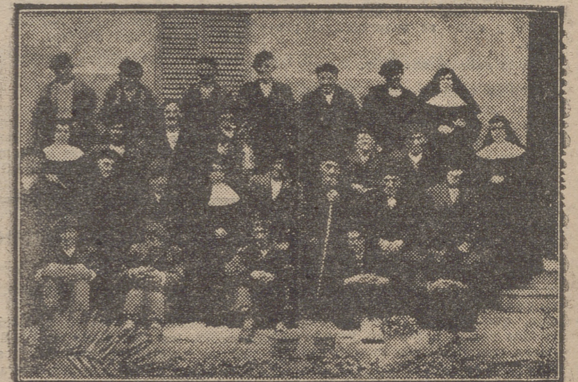
CALAHORRA.—GRUPO DE ANCIANOS ASILADOS