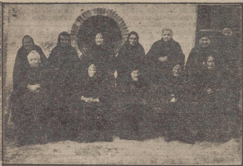
CALAHORRA.—GRUPO DE ANCIANAS ASILADAS