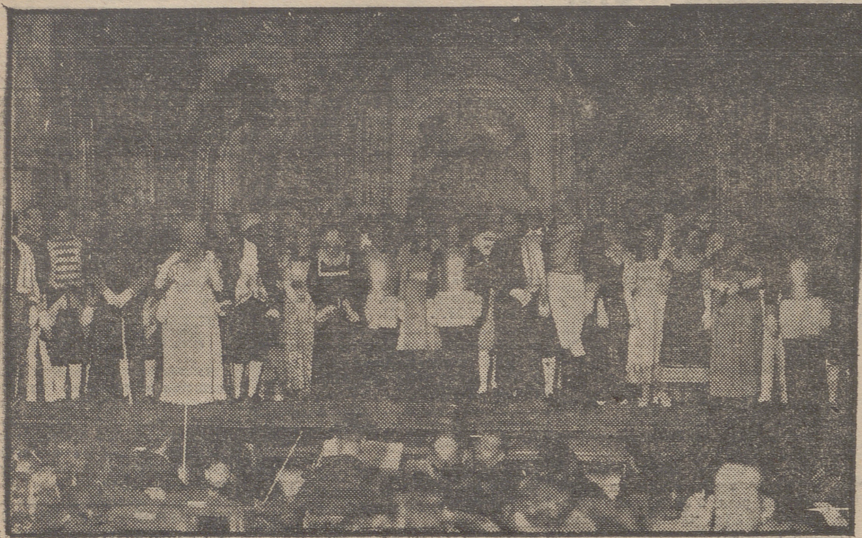
LOGROÑO.—DE LA FUNCION BENEFICA DE AYER: CONJUNTO DE INTERPRETES DE "LA VIEJECITA"

El anuncio en este periódico es la más eficaz propaganda de los productos y el incremento de las ventas