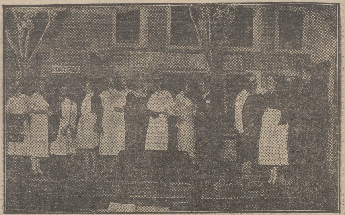
LOGROÑO.—AYER EN EL BRETON; LAS PRIMERAS PARTES Y CORO DE "LOS CLAVELES"